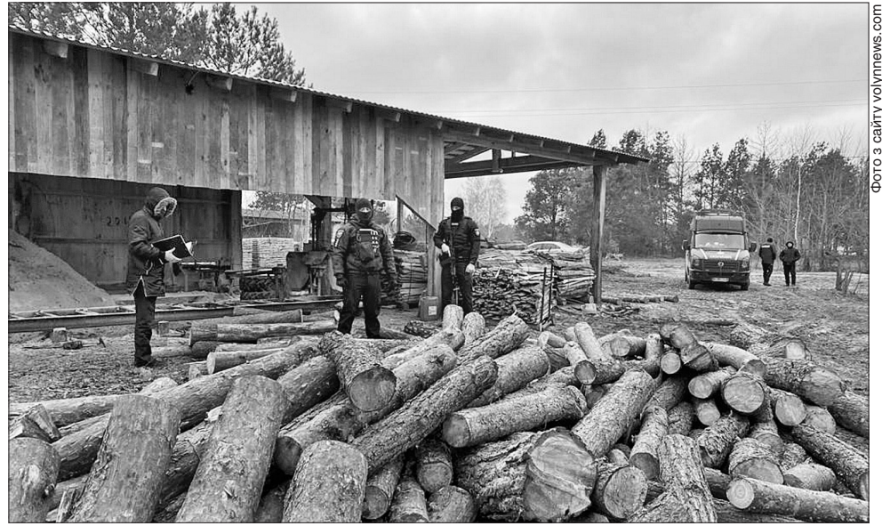
Правоохоронці дедалі частіше отримують сигнали, що вирубування здорових дерев маскують під санітарне

Вона наголосила, що впродовж останніх місяців народні депутати отримують тривожні сигнали і від локальних переробників, і