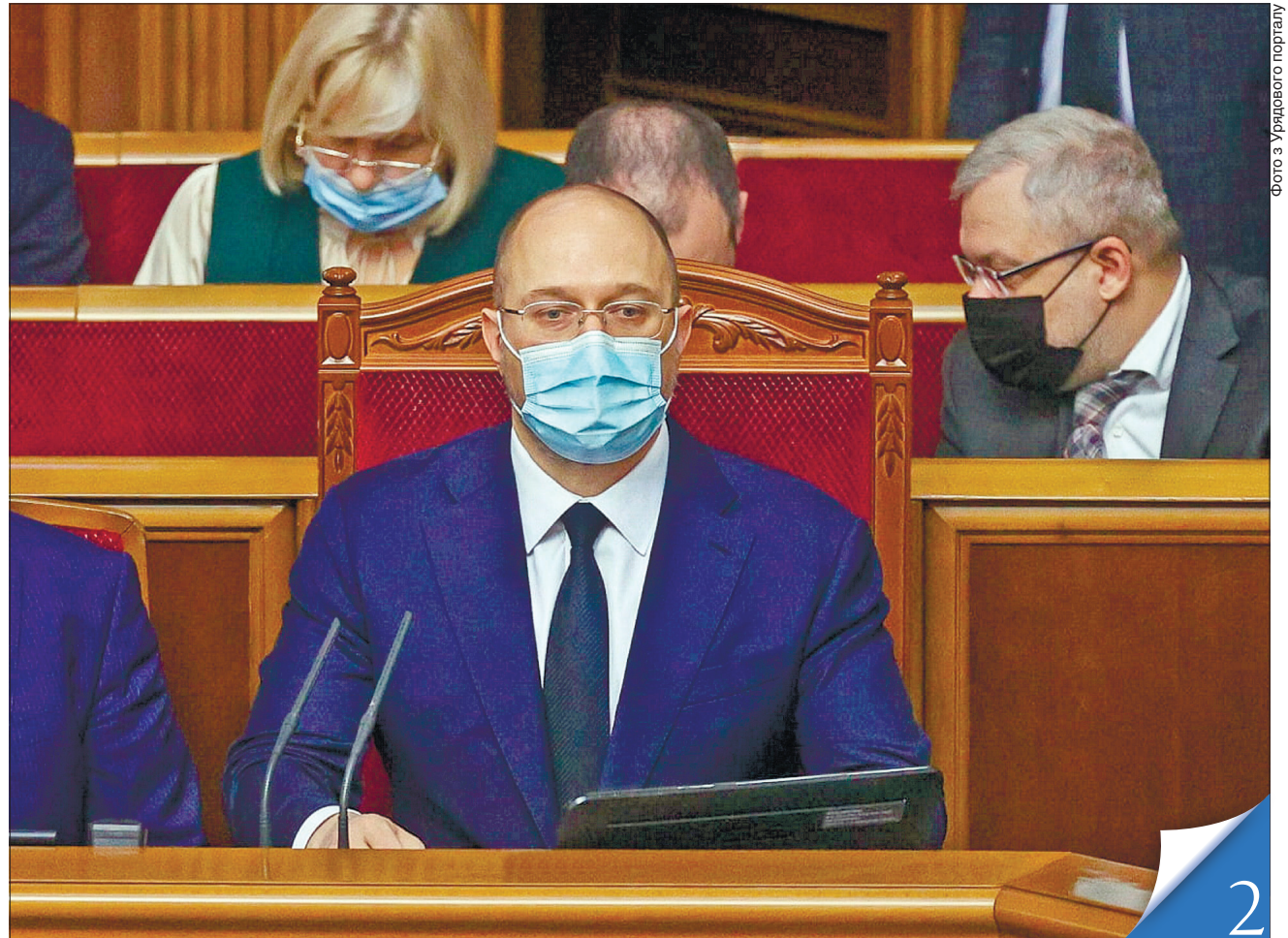
Прем'єр-міністр підкреслює: «Ми маємо достатні запаси енергоресурсів, аби стабільно пройти цей опалювальний сезон»

ГОДИНА ЗАПИТАНЬ ДО УРЯДУ. Влада запевнила українців, що спільно ми здолаємо всі виклики та загрози