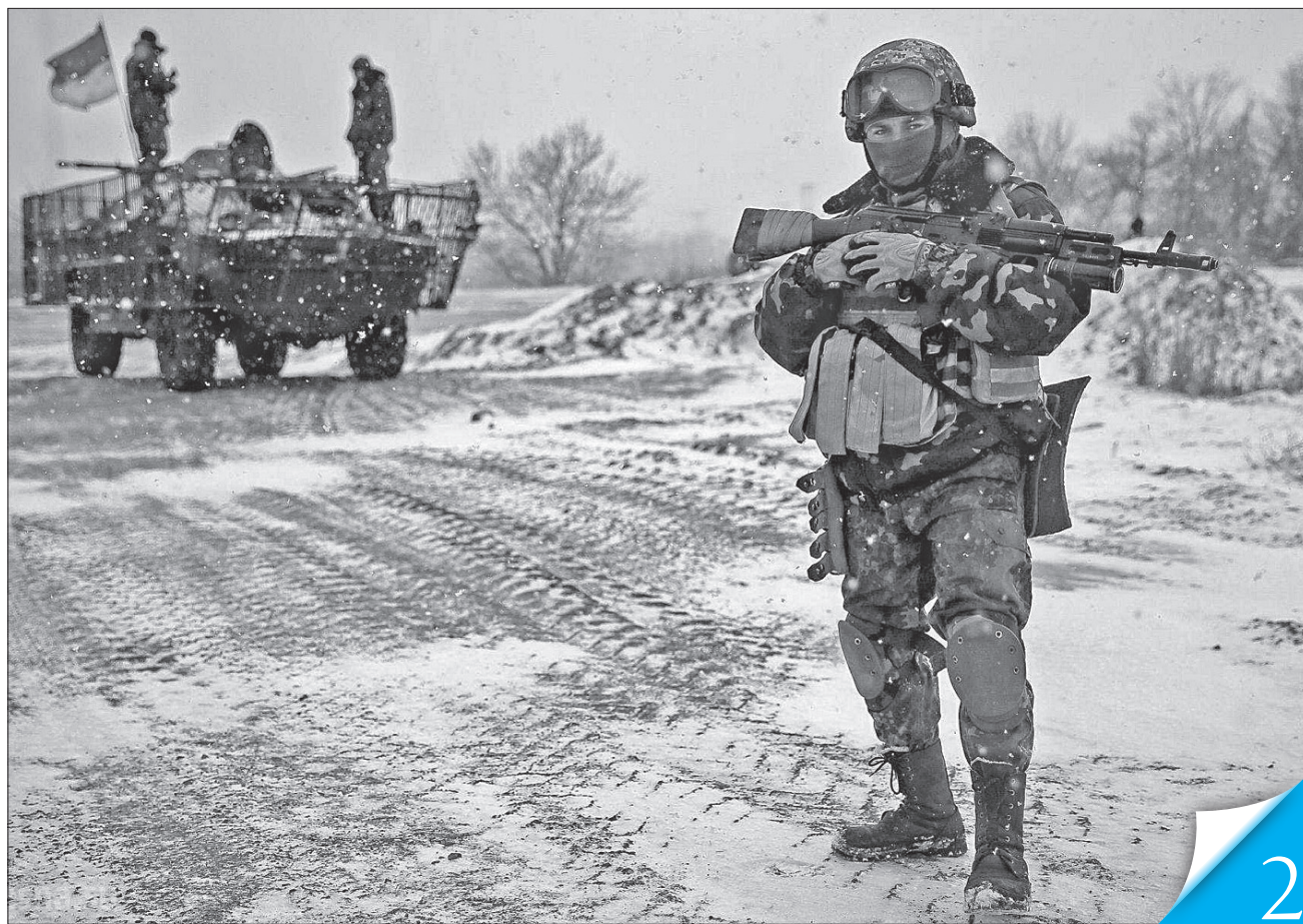
Україна постійно посилює свої оборонні можливості. У нас сильна, смілива, готова щодня до всього армія, переконаний глава держави

СТОСУЄТЬСЯ КОЖНОГО. У відеозверненні Президент закликав громадян зберігати спокій, холодну голову, впевненість у власних силах, нашій армії та своїй країні