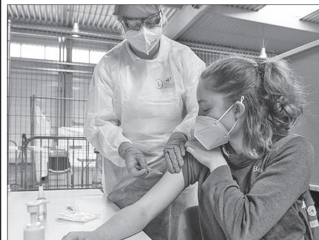
Чекати залишилося близько півтора року

Нову вакцину допрацюють науковці, і найближчим часом компанія розпочне етап клінічних випробувань. «У березні ми зможемо надати перші дані регуляторним органам, щоб визначити наші подальші дії», — сказав Стефан Бансель. Він повідомив, що цього року Moderna планує поставити 2—3 мільярди доз вакцини проти COVID-19. Для порівняння: торік компанія випустила 807 мільйонів доз цього препарату.