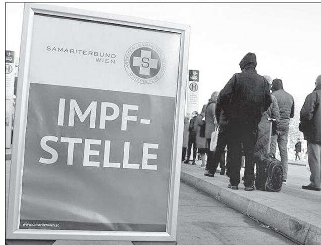
Таке нововведення сприйняли не всі громадяни

В Австрії, країні з населенням близько 9 мільйонів осіб, зафік-