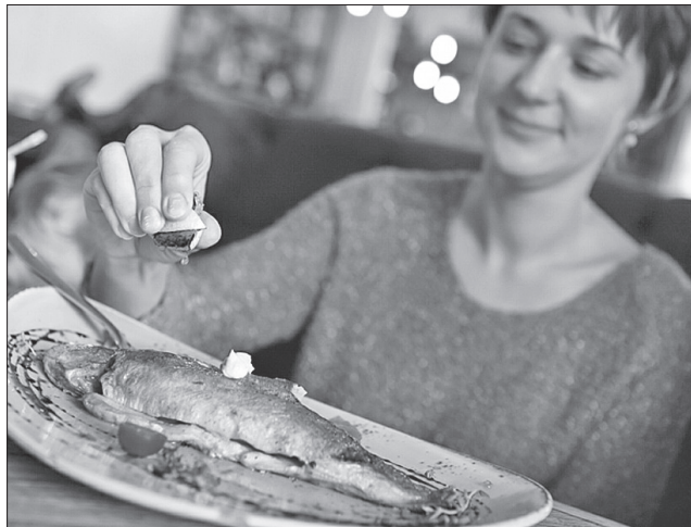
Де ловили, чим dopravляли, як готували...

Дослідження 2019 року, яке провела американська природоохоронна організація Oceana, засвідчило: риба, що з неї було приготовано кожну п'яту страву, яку куштували автори дослідження в ресторанах, неправильно марковано. Це означає, що споживач платить удвічі вищу ціну за те, щоб скуштувати страву з дикого лосося, а натомість йому подають лосося, вирощеного у фермерських умовах. Або клієнт може вважати, що їсть свіжоприготованого ома, а насправді його було заморожено багато місяців тому.