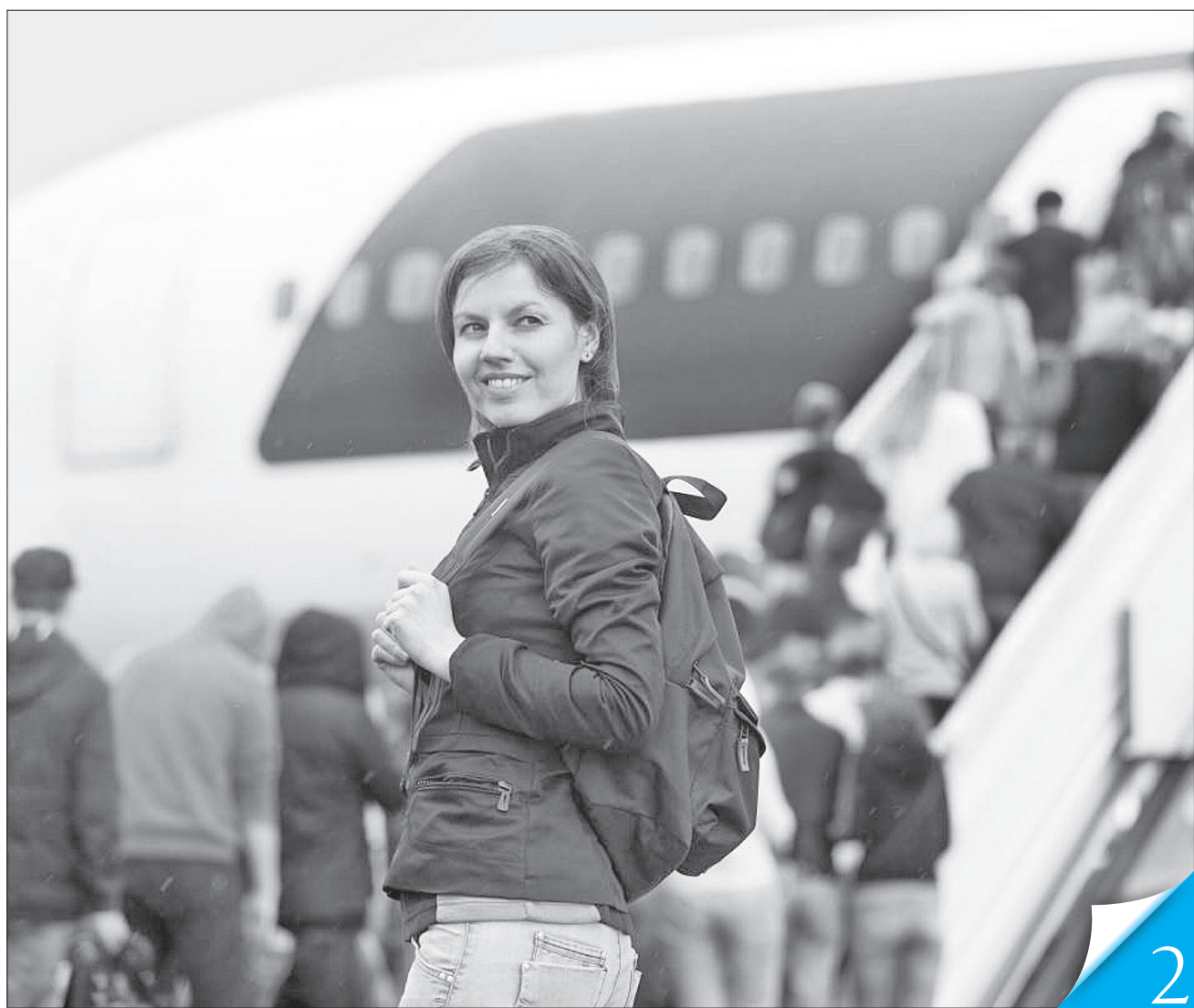
Авіаційний безвіз із Євросоюзом — це те, чим можна пишатися

УРЯД ЗВІТУЄ. Кабінет Міністрів презентує основні досягнення міністерств і відомств за підсумками 2021 року