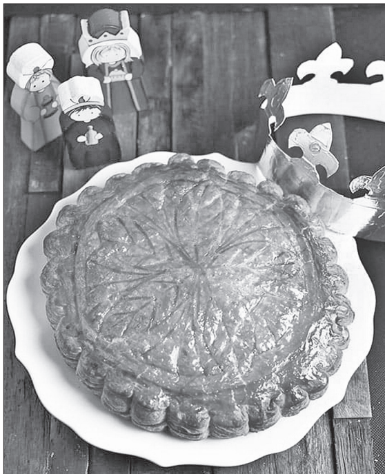
Пиріги з коштовними сюрпризами продаватимуть лише 6 січня

ТРАДИЦІЯ. 6 січня у більшості європейських країн відзначають День трьох святих королів. Вважається, що саме цього дня три королі (за іншою версією, волхви) принесли дари до колиски новонародженого Ісуса. 6 січня діти, одягнуті у костюми трьох євангельських королів, ходять будинками, співають пісні про Вифлеємську зірку і збирають гроші на благодійність.