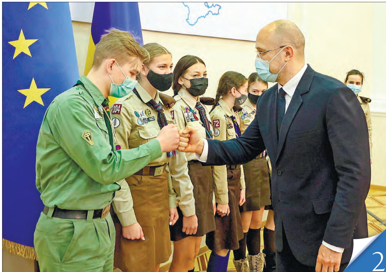
До урядовців завітали пластуни й передали їм часточку Віфлеємського вогню миру

ЗАСІДАННЯ КАБІНЕТУ МІНІСТРІВ. «ЄПідтримка» залучає нових учасників, а «ЄМалятко» спрощується й розширює функціонал