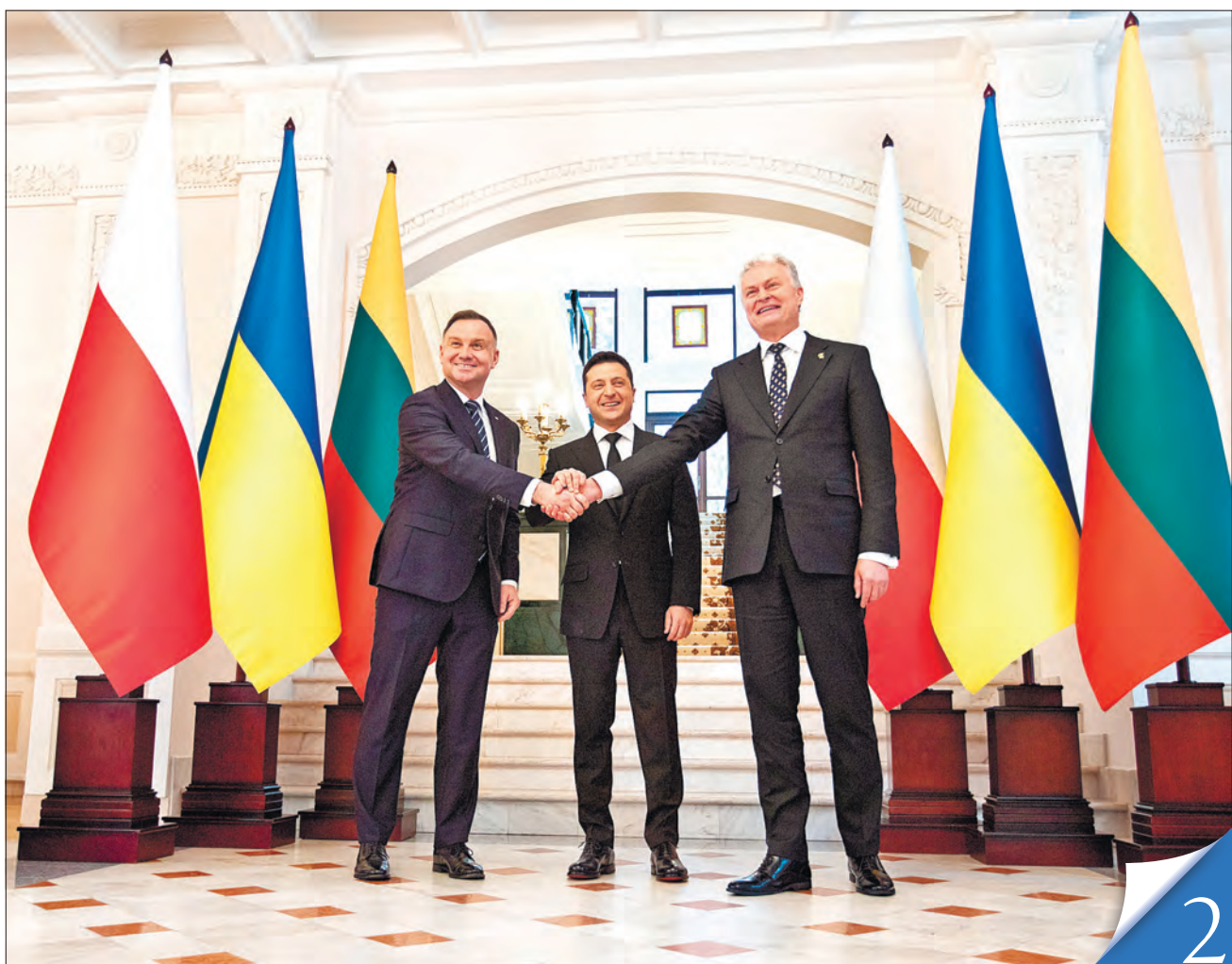
Президенти Анджей Дуда, Володимир Зеленський і Гітанас Науседа провели на Івано-Франківщині перший саміт «Люблінського трикутника»