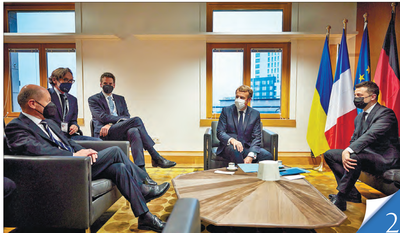
Зустріч канцлера ФРН Олафа Шольца, президентів Франції – Еммануеля Макрона та України – Володимира Зеленського у Брюсселі назвали неофіційним «нормандським форматом» у скороченому складі

Упродовж 2021 року потреба у видатках на лікарняні і страхові виплати перевищувала доходи фонду від частки ЄСВ. За підсумками листопада, перевищення потреби у видатках над фактичними доходами від частки ЄСВ сягнуло понад 2,7 мільярда гривень (з урахування заборгованості, накопиченої на початок місяця).