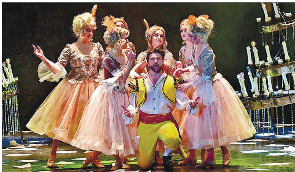
Фрагмент з опери «Весілля Фігаро» у виконанні акторів Національної оперети органічно вписаний у канву вистави

У різні часи сюжет про Моцарта і Сальєрі викликав інтерес і авторів, і глядачів. У XIX столітті Пушкін написав трагедію «Моцарт і Сальєрі», а Римський-Корсаков на цей сюжет створив оперу, в якій одну з головних партій виконував Федір Шаляпін. У XX столітті Пітер Шеффер написав п'єсу «Амадеус», світова прем'єра якої пройшла на сцені Королівського національного театру Великої Британії. Згодом режисер Мілош Форман за нею зняв фільм «Амадеус», відзначений вісьма Оскарами 1985 року.