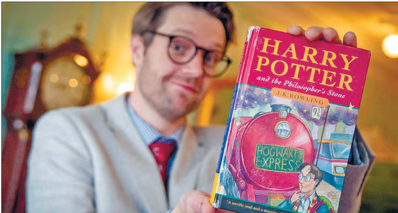
Книжку 1997 року видання продали за 471 тисячу доларів

ЛІТЕРАТУРА. Перше видання книжки у твердій обкладинці «Гаррі Поттер і філософський камінь» — першої із серії про юного чарівника британської письменниці Джоан Роулінг було продано під час аукціону за рекордно високу ціну.