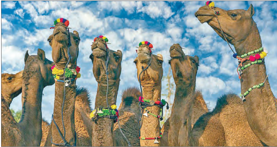
Ну, і хто з них найкрасивіший?

За даними інформаційного агентства Саудівської Ара-