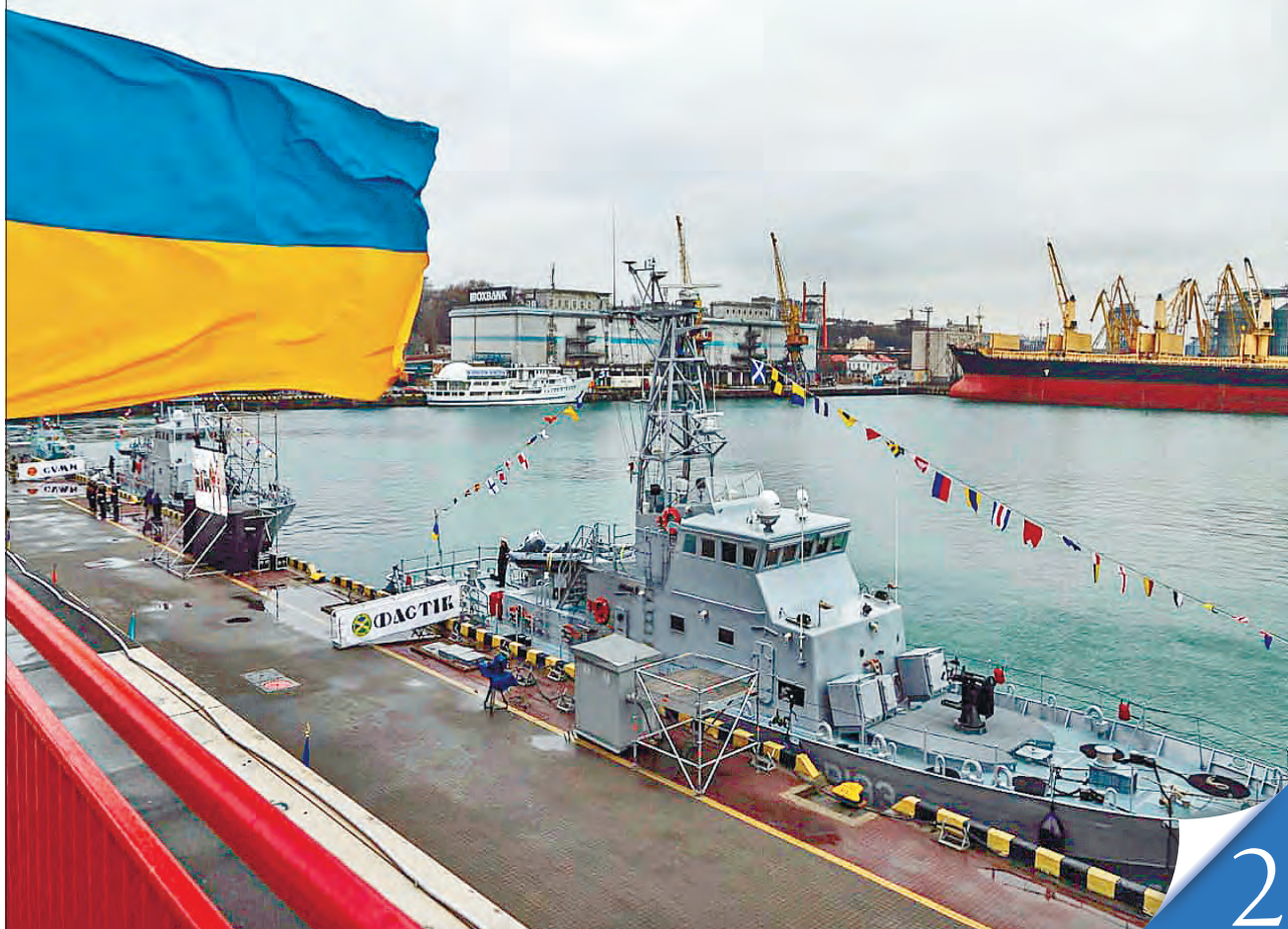
«Фастів» і «Суми» — два патрульні катери класу Island, днями передані США для зміцнення берегової охорони вітчизняних ВМС

НАЦБЕЗПЕКА. Наші Збройні сили стають дедалі сильнішими й боєдатнішими