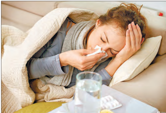
Лікарі визначатимуть захворювання за пів години

«Дуже важливо, щоб лікар міг отримувати оперативну ін-