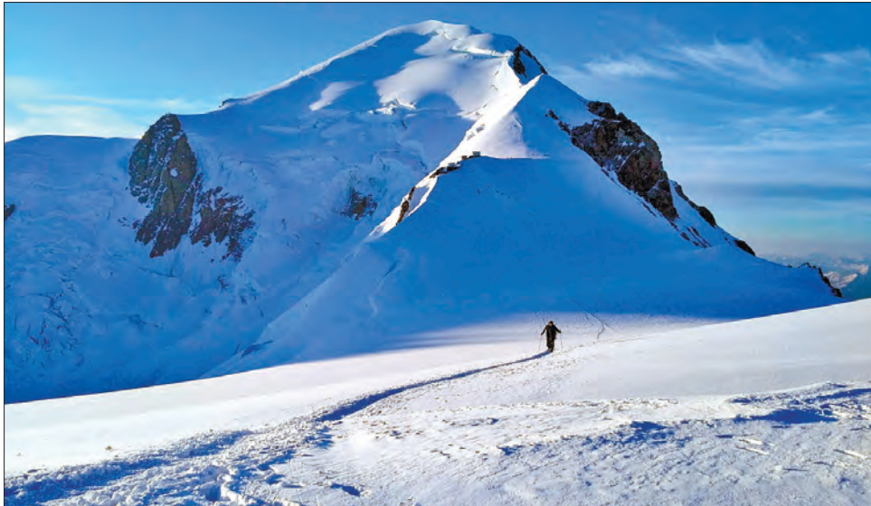
Скриньку з коштовностями було загублено понад 50 років тому під час однієї з авіакатастроф над Монбланом

Згідно із законами Франції, якщо власники загубленої речі не знаходяться протягом восьми років, то її чи її вартість ділять порівну між державою й тим, хто її знайшов. Влада комуни Шамоні, до якої належить Монблан, чекала вісім років, сподіваючись, що родичі чи спадкоємці таємничого власника скриньки заявлять про свої права на коштовності. Але вони так і не знайшлися. Експерти оцінили вартість коштовних каменів у 300 тисяч євро. Тож порядному альпіністові як винагорода дісталось 150 тисяч євро. Про це агентству FP