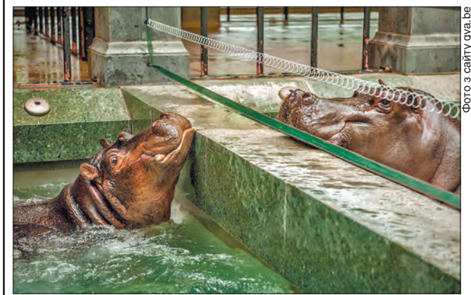
До цього випадку гіпотами не страждали на коронавірус