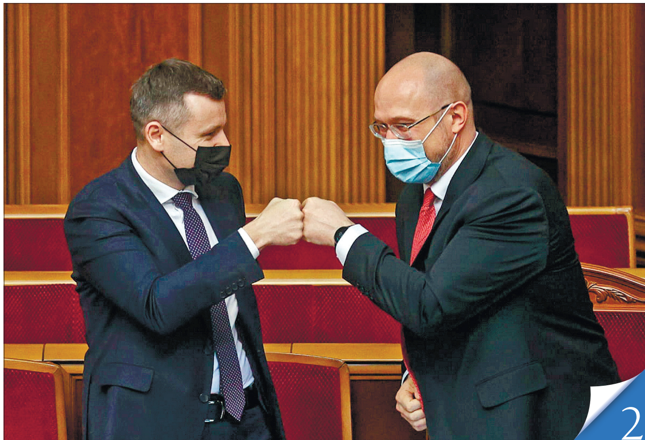
Прем'єр-міністр Денис Шмигаль висловив подяку за копітку роботу над державним кошторисом міністрові фінансів Сергію Марченку (ліворуч)

ЗАСІДАННЯ КАБІНЕТУ МІНІСТРІВ. Пріоритети кошторису незмінні: медицина, освіта, оборона та безпека, соціальна сфера, інфраструктура, підтримка бізнесу та інновацій