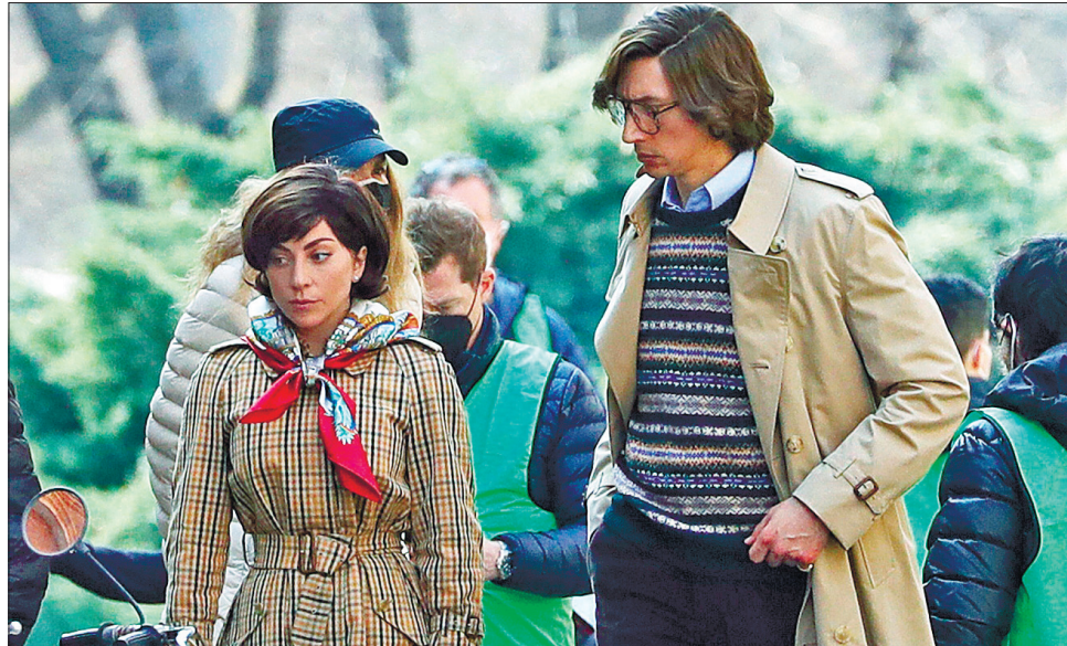
Втілені на екрані образи, переконує відома родина, не зовсім відповідають реальним прототипам

«Автори не спромоглися проконсультуватися зі спадкоємцями, перш ніж зобразити Альдо Гуччі — людину, яка була головою компанії протягом 30 років, та інших членів сім'ї як бандитів, неосвічених і байдужих до навколишніх. Це вкрай болючо і ображає спадщину, на якій нині будується бренд», — йдеться у відкритому листі. Тому, вважають Гуччі, образи їхніх родичів спотворено, а фільм не можна