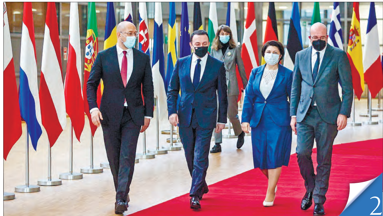
Прем'єр-міністри України, Грузії та Молдови Денис Шмигаль, Іраклій Гарібашвілі й Наталія Гаврілице провели у Брюсселі зустріч із президентом Європейської ради Шарлем Мішелем

ІСТОРІЯ. Вісім років тому, 1 грудня 2013-го, в Києві відбувся один із найвельюдніших мітингів, що дав поштовх подальшому посиленню впливу Євромайдану на суспільство. Спричинив народне невдоволення жорстокий розгін спецпідрозділом «Беркут» студентів, які протестували проти рішення уряду зупинити підготовку до угоди про асоціацію з Євросоюзом. Відбулася ця спецоперація в ніч проти 30 листопада на київському Майдані Незалежності й мала цинічну назву «розчищення території для встановлення новорічної ялинки». Ноги холонуть від тих моторошних кадрів, на яких озвірілий «Беркут» гумовими кийками й ногами витісняв людей з-під монумента Незалежності. Людей били й після падіння й завданих травм. Єдиним прихистком, нагадає Укрінформ, став Михайлівський собор, який тієї ночі відчинив ворота для багатьох переслідуваних. Попри сподівання злочинної влади на силу, ці події стали переломними в українських протестах кінця 2013 року.