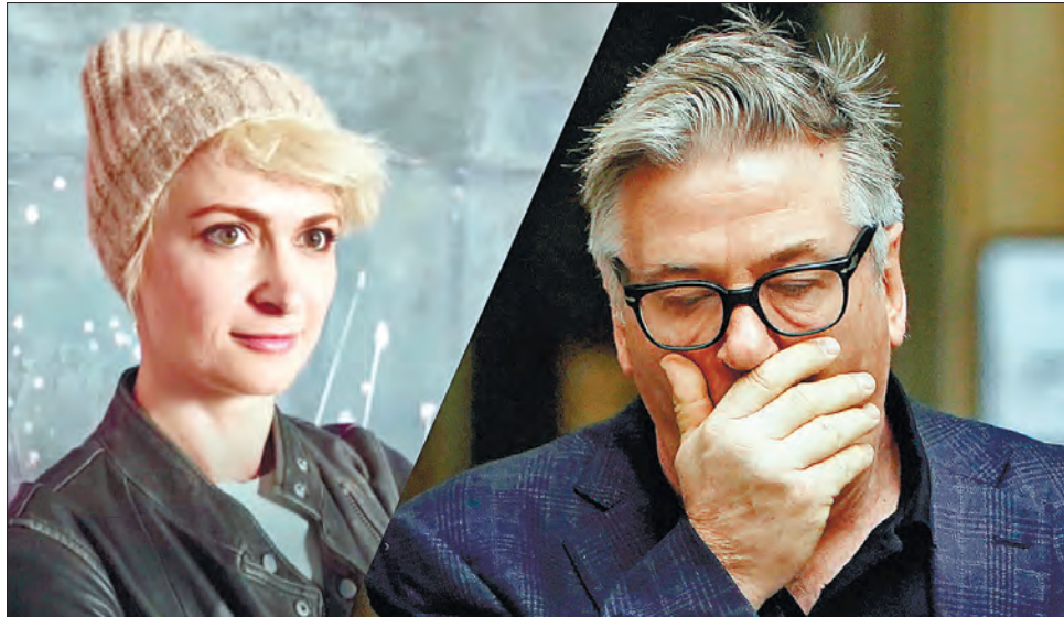
Ця трагічна історія ще довго збурюватиме Голлівуд

У документі йдеться, що Светний відчув, як куля пролетіла повз нього, після чого на його обличчі з'явилися сліди пороху. Алек Болдуїн, поміч-