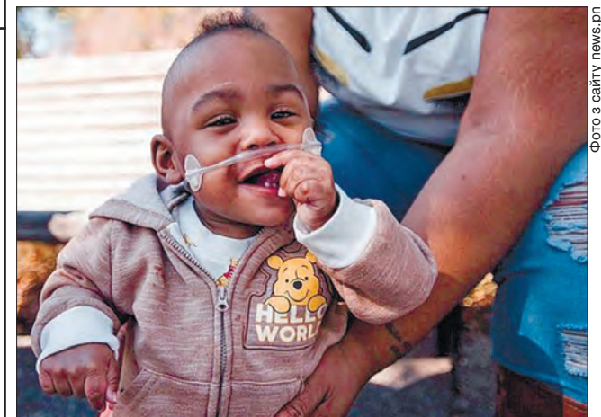
Медицина дедалі більше здатна творити дива

Попередній рекорд немовляти, яке з'явилося передчасно на світ, належав Річардові Гатчинсону з Вісконсину. Він народився всього на 24 години пізніше, ніж Кертіс, на терміні 21 тиждень і два дні.