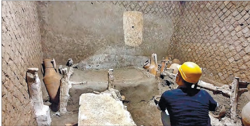
Знахідка дає уявлення сучасникам про побут нижніх верств населення Римської імперії

У кімнаті площею 16 квадратних метрів знайшли три дерев'яні ліжка, керамічні глечики і горщик. Два ліжка завдовжки близько 1,7 метра, одне — лише 1,4 метра. У кімнаті було маленьке вікно. У кутках стояли амфори й дерев'яна скриня, в якій були металеві предмети й залишки тканини, що, як вважають науковці, могли бути частинами упряжі для коней.