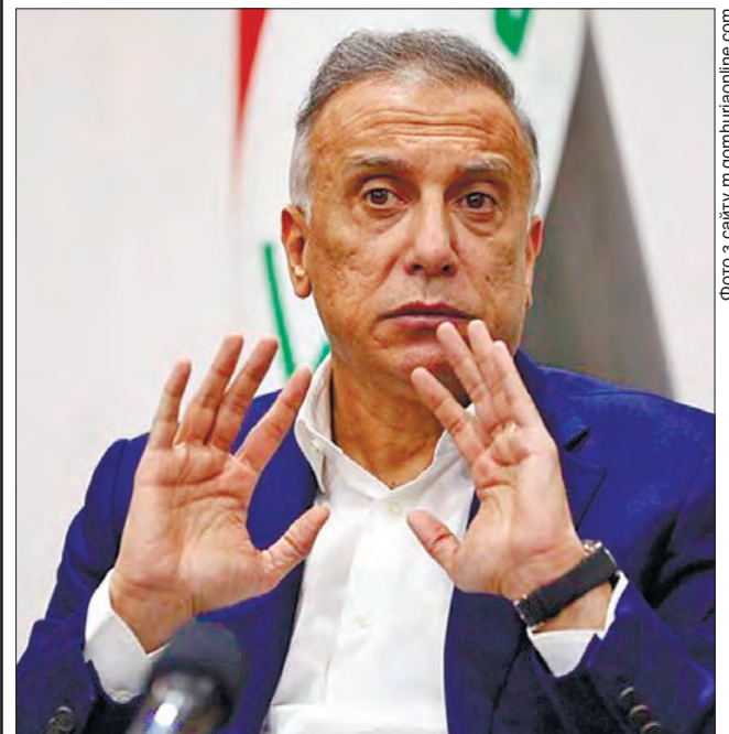
Главі уряду, на щастя, вдалося вижити після атаки дронів

Місцеві ЗМІ повідомили, що під час замаху було використано три безпілотники, два з яких збили. Резиденція прем'єр-міністра Іраку розташована в зеленій зоні Багдада, що добре охороняється, де розміщено іноземні посольства та урядові об'єкти. На момент публікації матеріалу ніхто не взяв на себе відповідальність за напад.