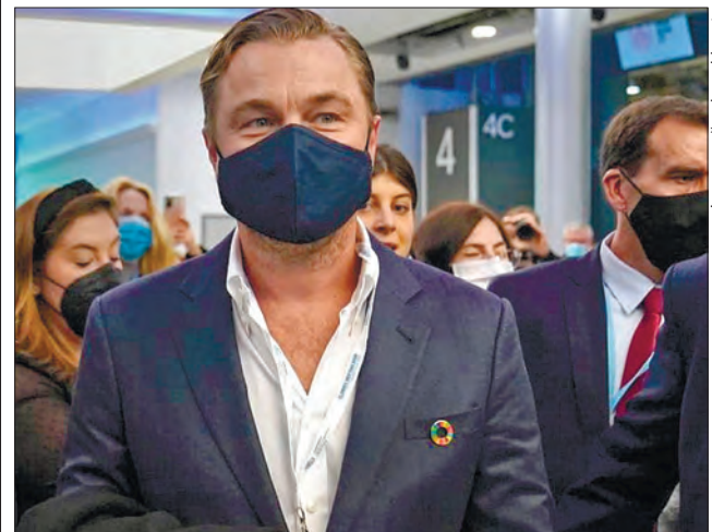
Леонардо Ді Капріо жертвує мільйони доларів екологічним організаціям та вкладає інвестиції в підприємства з відновлюваним циклом виробництва

Леонардо Ді Капріо пожертвував мільйони доларів екологічним організаціям і вкладає інвестиції в підприємства, які працюють за принципами відновлюваного виробництва. У 2019 році він підтримував екологічний рух, який започаткувала шведська школярка Грета Тунберг, і після особистої зустрічі з дівчиною назвав її «лідером нашого часу». У 2016 році на церемонії вручення кінопремії «Оскар» Ді Капріо виступив із промовою, в якій назвав зміну клімату найневідкладнішою загрозою, з якою стикається людство.