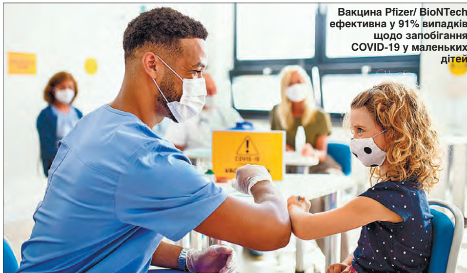
Вакцина Pfizer/BioNTech ефективна у 91% випадків щодо запобігання COVID-19 у маленьких дітей

Представники управління з контролю за продуктами й медикаментами (FDA) дійшли висновку, що вакцина Pfizer/BioNTech ефективна у 91% випадків щодо запобігання COVID-19 у маленьких дітей, і що їхня імунна відповідь на щеплення була такою самою, як у молоді 16—25 років. Науковці не зафіксували жодних серйозних побічних ефектів. Для щеплення дітей від 5 до 11 років потрібна третина дози для дорослих. Необхідні голки меншого розміру, а другу дозу вакцини мають увести через три тижні після першої.