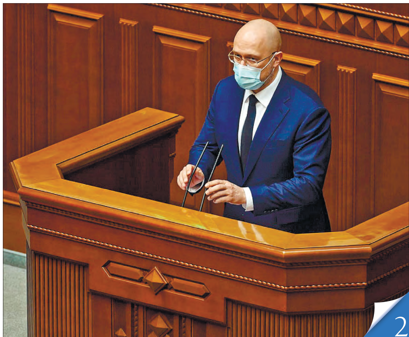
Прем'єр-міністр Денис Шмигаль оголошував з трибуни Верховної Ради подання кандидатів на посади очільників МінТОТ, Мінстратегпрому й Мінекономіки

КАДРОВІ ЗМІНИ. Верховна Рада призначила нових очільників Міноборони, МінТОТ, Мінстратегпрому та Мінекономіки