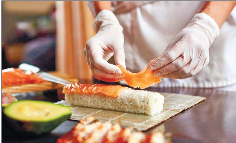
То як тепер готувати: голіруч чи в рукавичках?

Вони знайшли істотний вміст небезпечних хімічних речовин у гамбургерах, курячих нагетсах, буріто та інших стравах фаст-фуду. «Ми виявили ортофталати, або заміні-