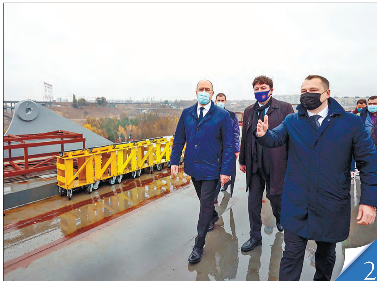
Завершення будівництва вантового мосту автотранспортної магістралі через Дніпро в Запоріжжі забезпечить надійний логістичний зв'язок між берегами річки через острів Хортиця, переконаний глава уряду

перераховано на державні шахти для повного погашення заборгованості за липень — серпень і на зарплати за вересень