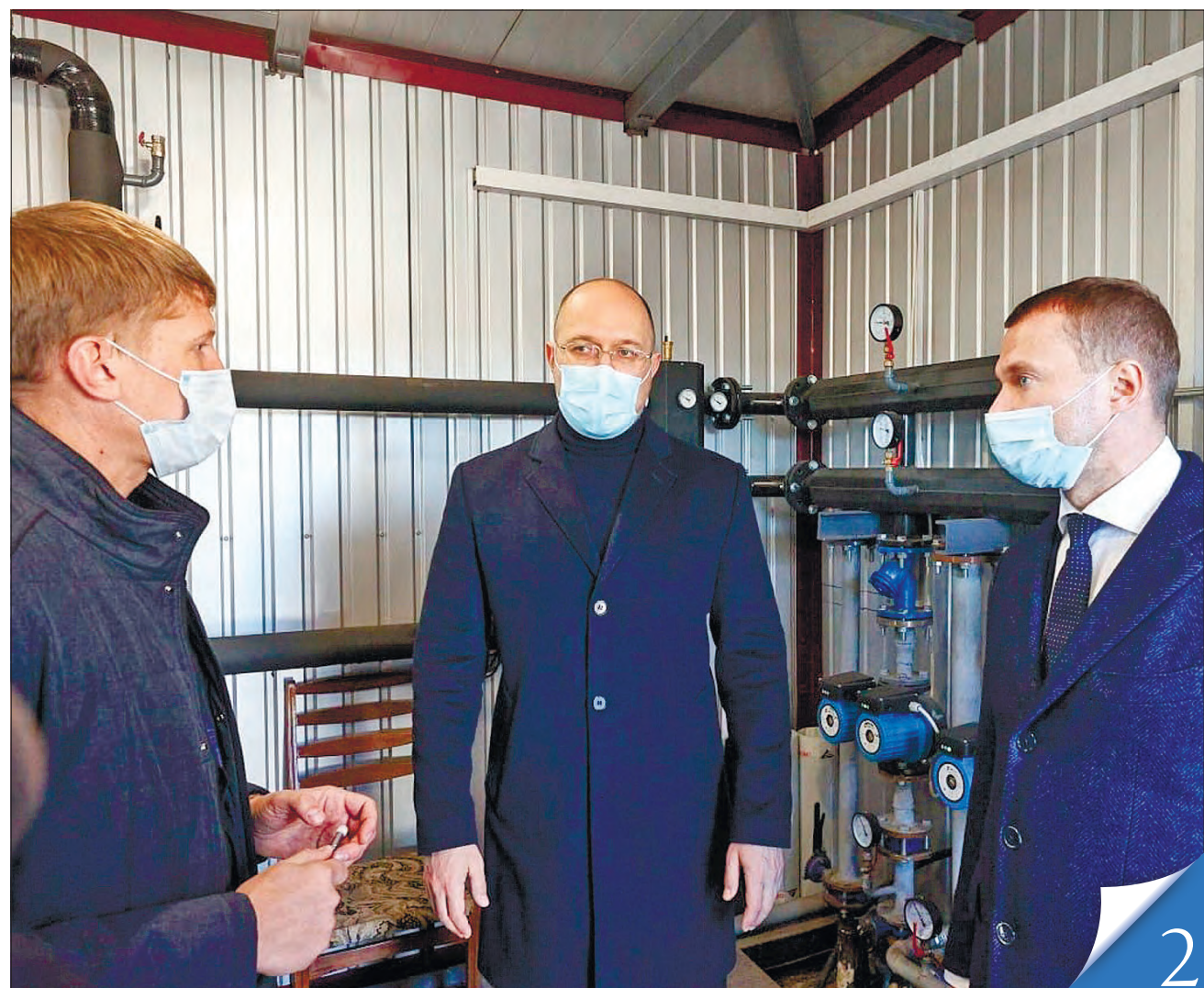
Нові модульні твердопаливні котельні мінімізують втрати тепла, вважає Прем'єр-міністр Денис Шмигаль