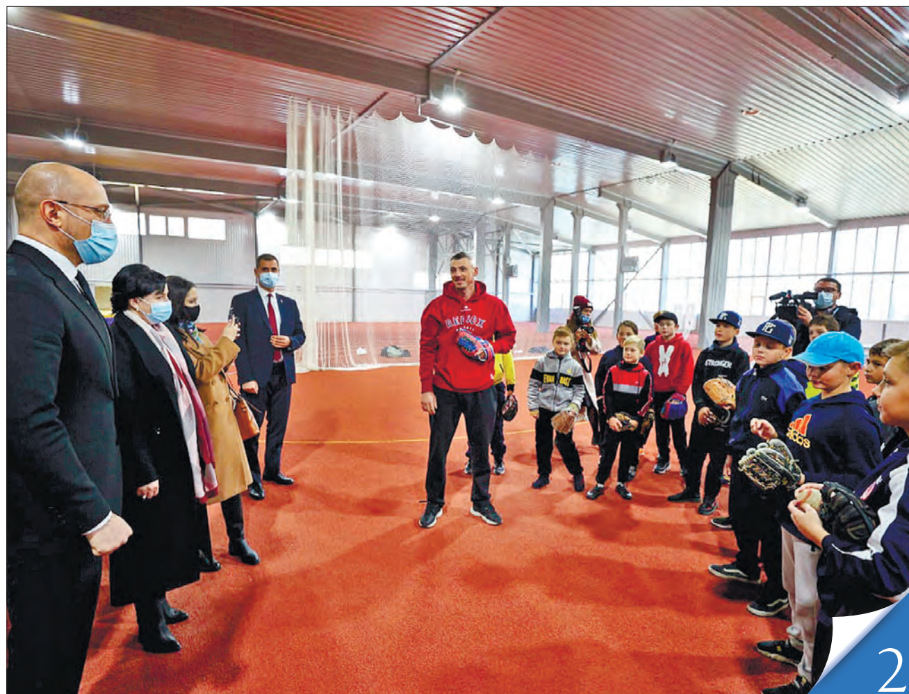
У Кропивницькому Прем'єр-міністр Денис Шмигаль ознайомився зі станом реконструкції обласної спеціалізованої дитячо-юнацької школи Олімпійського резерву-2

ПРІОРИТЕТИ. Кабмін робить ставку на модернізацію підприємств теплокомуненерго, мереж, утеплення будинків і об'єктів соціальної інфраструктури