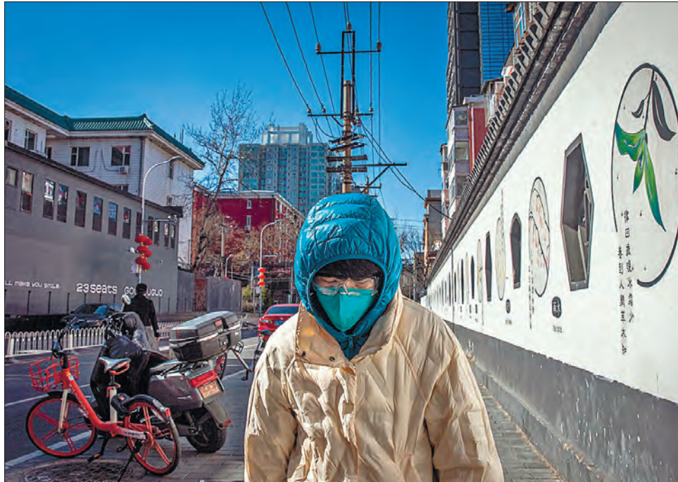
Обпкісь на пандемії, нині влада Піднебесної дмухає і на холодне, вважаючи кожен випадок зараження ковідом надзвичайною ситуацією

Хоч кількість нових хворих у Китаї можна вважати помірною порівняно з іншими країнами, наприклад Сингапуром і Великою Британією, темпи поширення коронавірусу викликають занепокоєння уряду, який намагається боротися з пандемією. Перший спалах хвороби було виявлено минулого тижня серед членів туристської групи, яка складалася з повністю вакцинованих літніх людей із Шанхая, що подорожували кількома північними регіонами країни. Відтоді повідомлення про заражених надійшли майже із третини провінцій, і всі регіони, яким присвоєно статус середнього та високого ризику, лежать на півночі КНР. Цими вихідними влада Пекіна наклала жорсткі обмеження на в'їзд у місто, вимагаючи, щоб ті, хто приїжджає з регі-