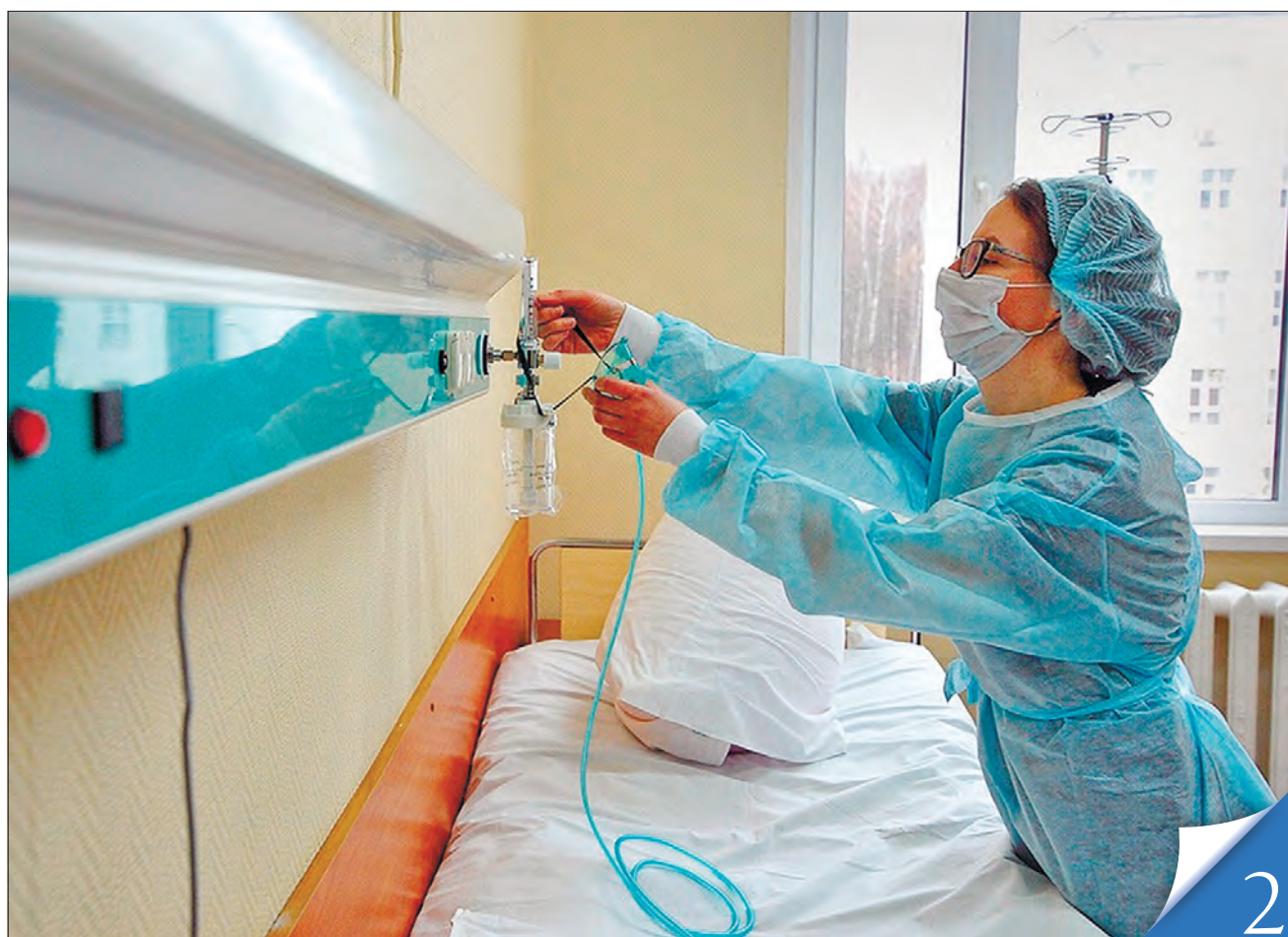
Урядовці спростовують чутки про брак кисню в ковідних лікарнях і запевняють: усі пацієнти, які потребують кисневої терапії, її отримують

ГОДИНА ЗАПИТАНЬ ДО УРЯДУ. Добовий рекорд з кількості щеплених становить 270 тисяч громадян