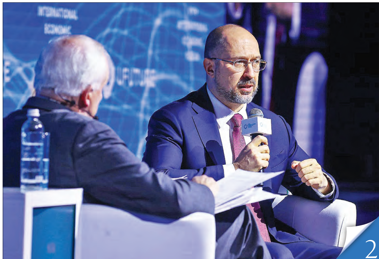
Глава уряду взяв участь у роботі Київського міжнародного економічного форуму

ГЛОБАЛІЗАЦІЯ. Прем'єр-міністр Денис Шмигаль вважає, що спричинена пандемією криза вимагає від урядів усіх країн лідерства й неординарних рішень