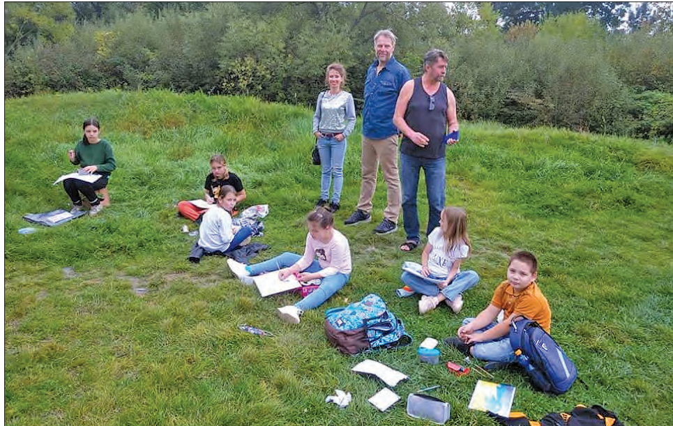
Учні з готовими роботами очікують на вердикт наставників

Цікаво було й дорослим. Вони, вже сформовані митці, згадали, як самі колись училися малюванню і, спілкуючись