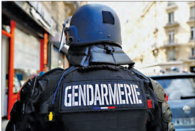
Злочинця шукали понад 30 років, а він наклав на себе руки від страху бути покараним