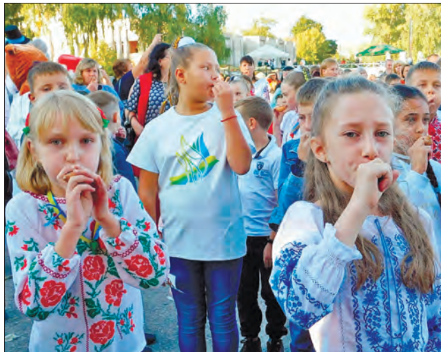
Свістили у Валках, почули — в Києві

Як розповіла ініціаторка дійства, до заходу в межах підготовки до святкування 375-річчя із дня заснування Валок готувалися майже рік. Нові керівники міста поставили за мету не просто провести урочистості, а й подивувати