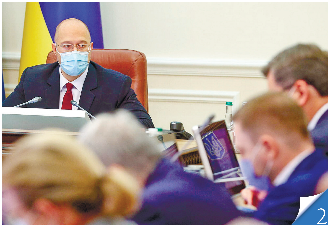
Прем'єр-міністр Денис Шмигаль впевнений у стабільному проходженні опалювального сезону

ЗАСІДАННЯ КАБІНЕТУ МІНІСТРІВ. Понад 150 тисяч житлових будинків, лікарні, заклади освіти і культури зустрінуть холоди у всеозброєнні