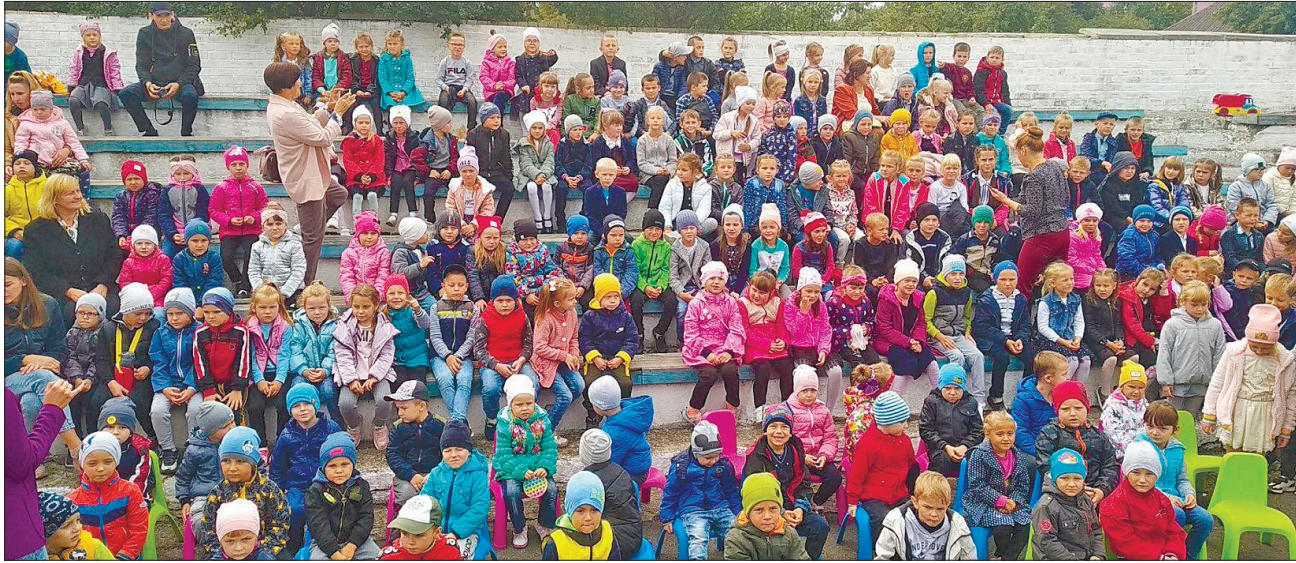
У Володимирці вистава відбулася на стадіоні «Янтар»

МИСТЕЦТВО. Рівненські лялькарі виграли грант Українського культурного фонду в рік 30-річчя Незалежності