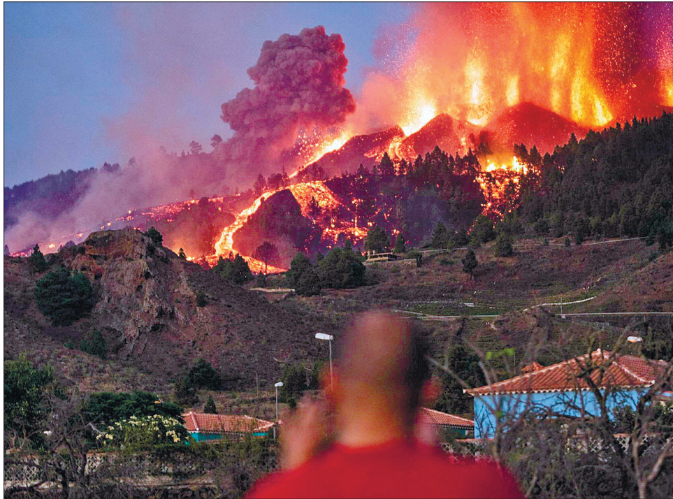
Розпечена лава вогняним потоком мчала зі схилів вулкана, спалюючи все живе на шляху

«Наш пріоритет — гарантування безпеки громадян Ла-Пальми, які можуть стати жертвами наслідків цього виверження», — заявив Педро Санчес. В іспанському уряді побоюються, що розпечена лава може стати причиною пожеж. Про людські жертви офіційних повідомлень поки що немає. Місцева влада видала накази про термінову евакуацію жителів чотирьох сіл, які опинилися в зоні стихійного лиха. Було ева-