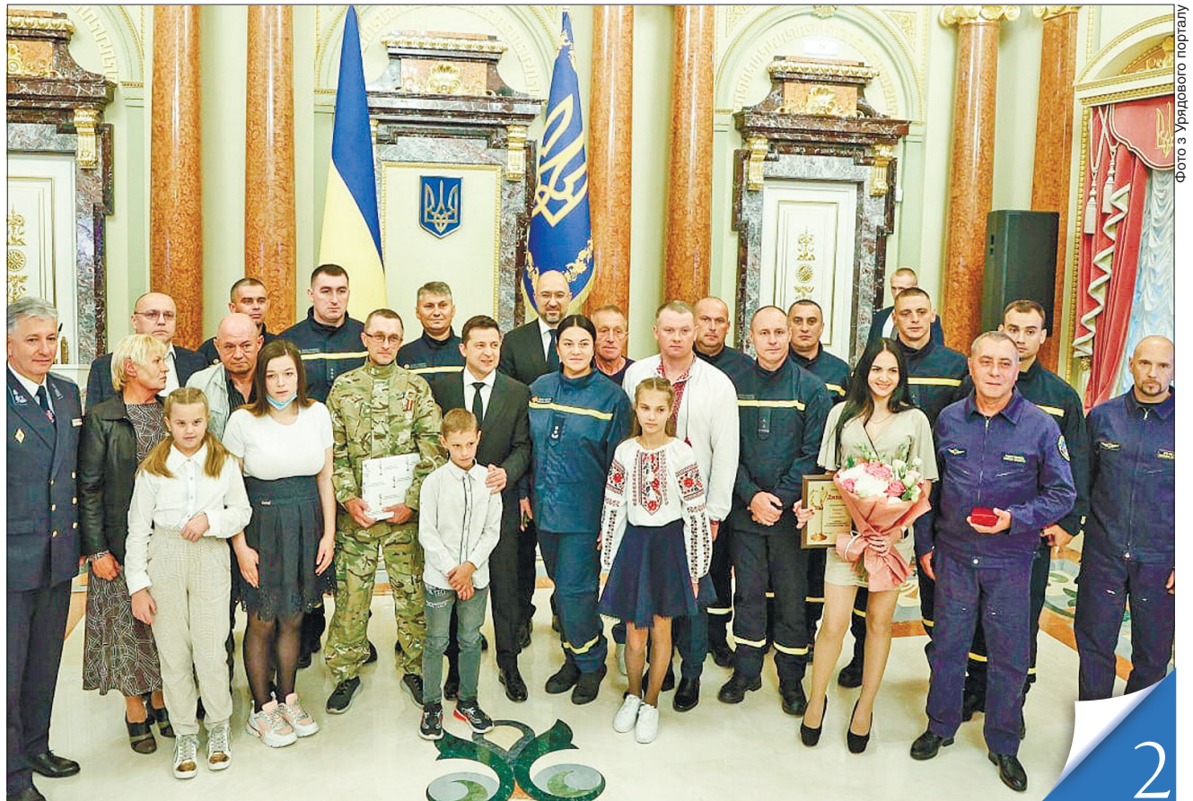
3 нагоди професійного свята в Маріїнському палаці Президент Володимир Зеленський і Прем'єр-міністр Денис Шмигаль вітали співробітників ДСНС, а також лауреатів Всеукраїнської акції «Герой-рятувальник року»

ПОДВИГ У ЖИТТІ. У День рятувальника разом із професіоналами нагороди в Маріїнському палаці отримали й небайдужі громадяни, які не змогли пройти повз чужу біду