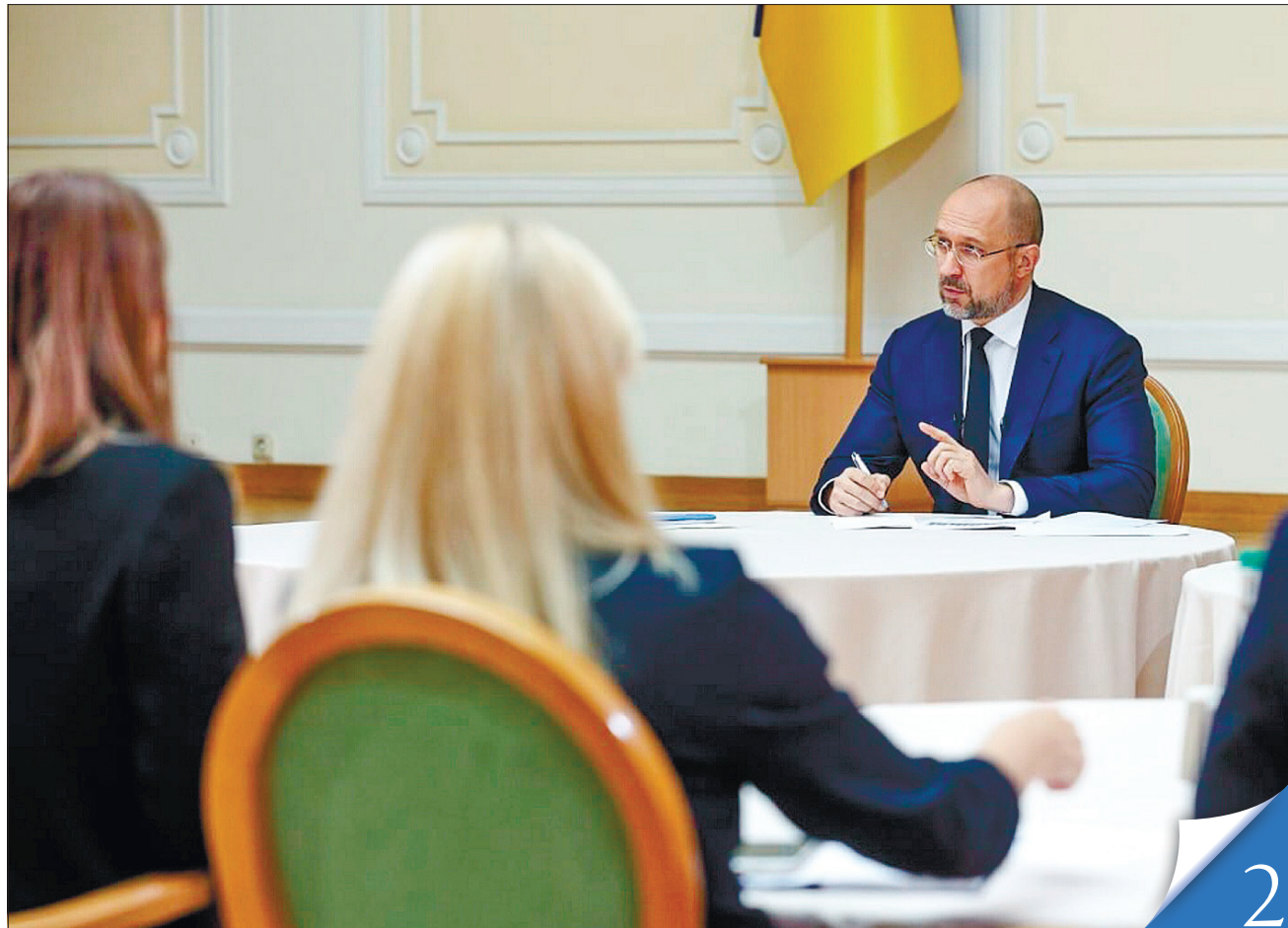
Широке спілкування з пресою Прем'єр-міністра Дениса Шмигала ознаменувало відкриття нового політичного сезону