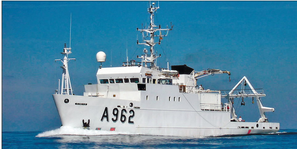
Шляхом до Одеси екіпаж часу не марнуватиме — здійснить чимало нових досліджень