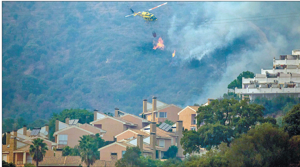
Глобальне потепління випалює різні куточки нашої планети

А екологи вже не вагаються, що подібні пожежі — на-