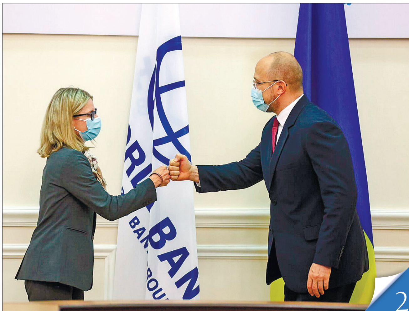
У присутності Прем'єр-міністра Дениса Шмигала й віцепрезидента Світового банку у справах регіону Європи та Центральної Азії Анні Б'єрде було укладено дві важливі для України угоди

МІЖНАРОДНА СПІВПРАЦЯ. Сторони підписали критично важливі угоди у сферах енергетики та освіти