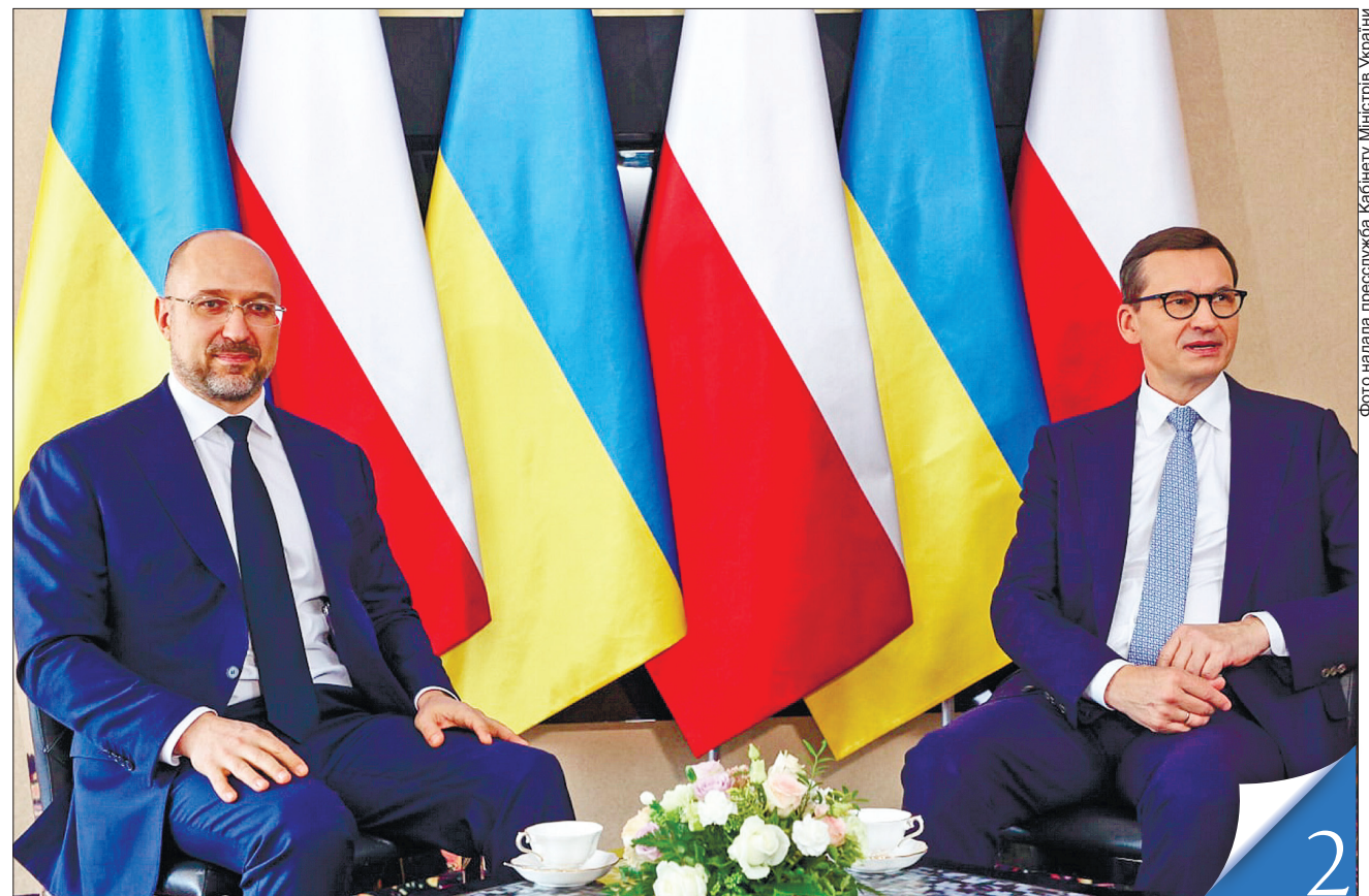
У польському місті Карпач Прем'єр-міністр України Денис Шмигаль і голова Ради міністрів Республіки Польща Матеуш Моравецький обговорили питання зміцнення й розвитку двосторонніх відносин

МІЖНАРОДНА СПІВПРАЦЯ. Наша країна прагне стати невід'ємною частиною Тримор'я, адже така співпраця матиме великий потенціал