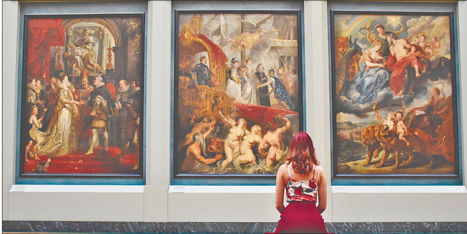
Відвідання музеїв позитивно впливає на психологічно уразливих пацієнтів

У мерії Брюсселя цю ініціативу оприлюднили за кілька днів після того, як бельгійський уряд затвердив програму, що дає змогу відвідувати психо-