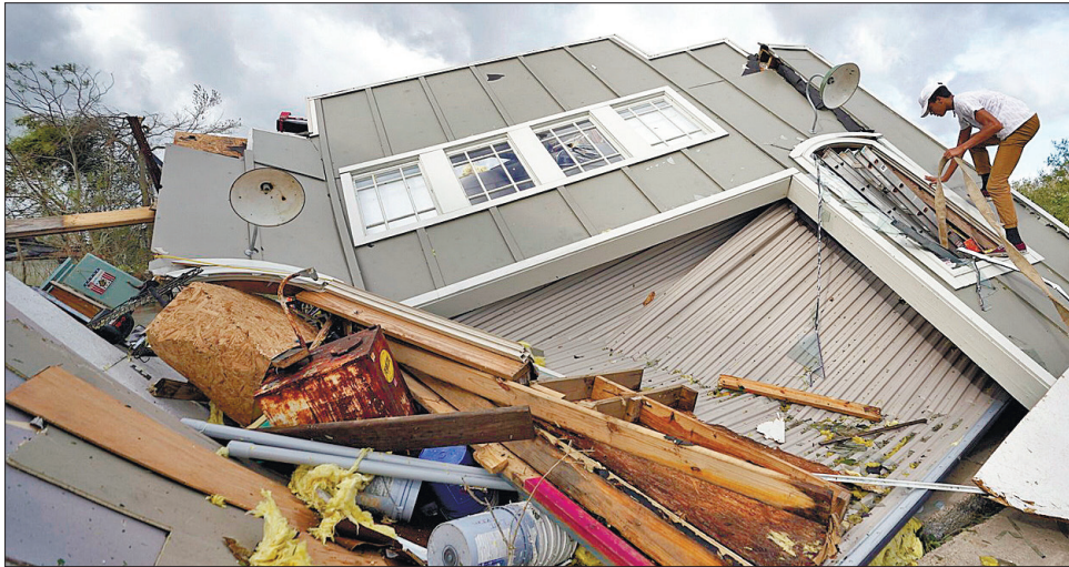
Швидкість урагану подекуди сягала 240 км на годину

На численних відео в соціальних мережах видно, як стрімкі потоки води затоплюють станції нью-йоркського метрополітену, житлові будинки й дороги. Національна метеорологіч-