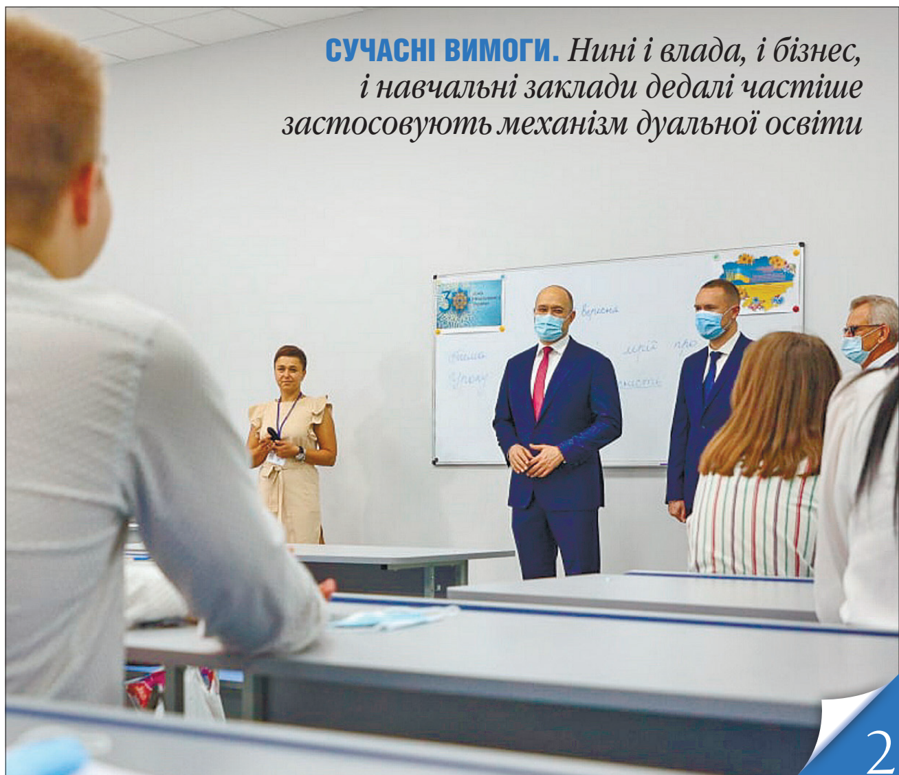
Прем'єр-міністр Денис Шмигаль привітав із Днем знань учнів і викладачів Київського вищого професійного училища будівництва і дизайну

СУЧАСНІ ВИМОГИ. Нині і влада, і бізнес, і навчальні заклади дедалі частіше застосовують механізм дуальної освіти