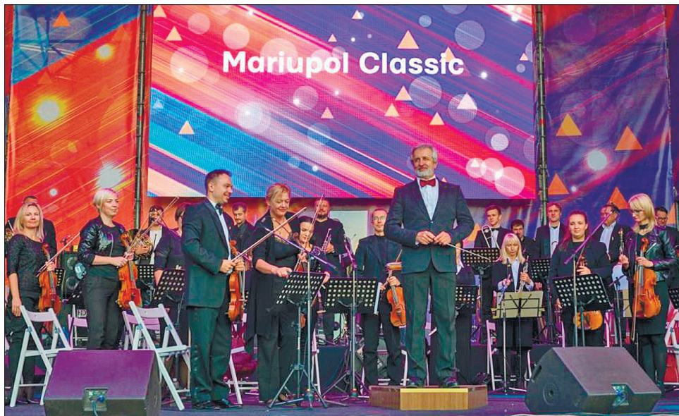
Четвертий рік поспіль цей фестиваль дарує людям радість справжньої музики

«Завдяки таким фестивалям ми не просто даємо людям змогу насолодитися якісною музикою. Ми формуємо нову візію Маріуполя, міста з величезними культурними й туристичними можливостями. Ми заявляємо на всю країну, що наше місто біля моря справді вважають культурним центром України», — констатує Маріупольський міський голова Вадим Бойченко.