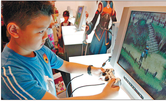
Година у п'ятницю, у вихідні й святкові дні — такі будні тамтешніх геймерів до 18 років

Китайська влада видала спеціальну інструкцію для ігрових компаній, де йдеться, що самі компанії мають зробити так, аби діти не могли грати довше визначених часових меж.