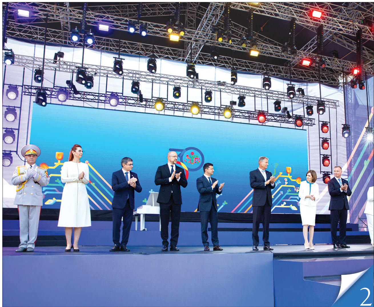
Президент Володимир Зеленський і Прем'єр-міністр Денис Шмигаль у Кишиневі взяли участь в урочистостях з нагоди 30-річчя незалежності сусідньої та дружньої Молдови

ПАРТНЕРСТВО. Обидві держави обстоюють свою вистраждану незалежність і торують шлях у Європу