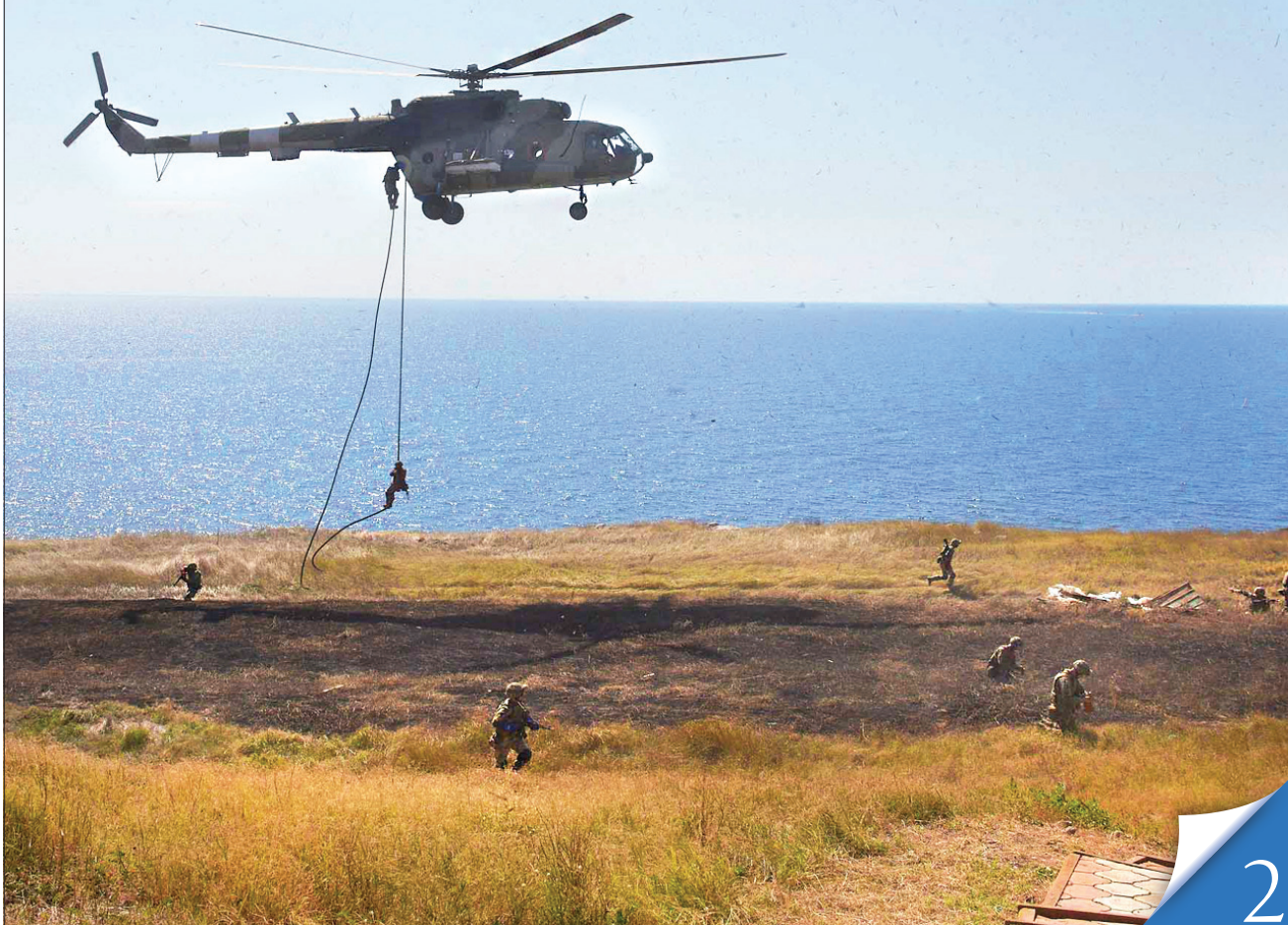
Полігон «Широкий лан» Миколаївщини та острів Зміїний стали одними з арен масштабних навчань нашого війська, спрямованих на відбиття атак з моря, повітря й суходолу

БОЙОВИЙ ВИШКІЛ. Зміни в керівництві Збройних сил і окремих їх видів справили позитивний вплив на стан війська та його здатність протистояти зовнішній агресії