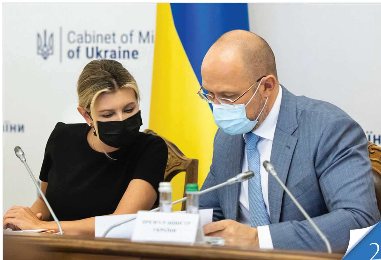
Прем'єр-міністр Денис Шмигаль і перша леді Олена Зеленська намагаються знайти відповідь на це болюче питання сьогодення

ПРОТИДІЯ. Уряд забезпечуватиме стабільну роботу мережі спеціалізованих служб підтримки постраждалих осіб — притулків, гарячих ліній, центрів надання допомоги, мобільних бригад