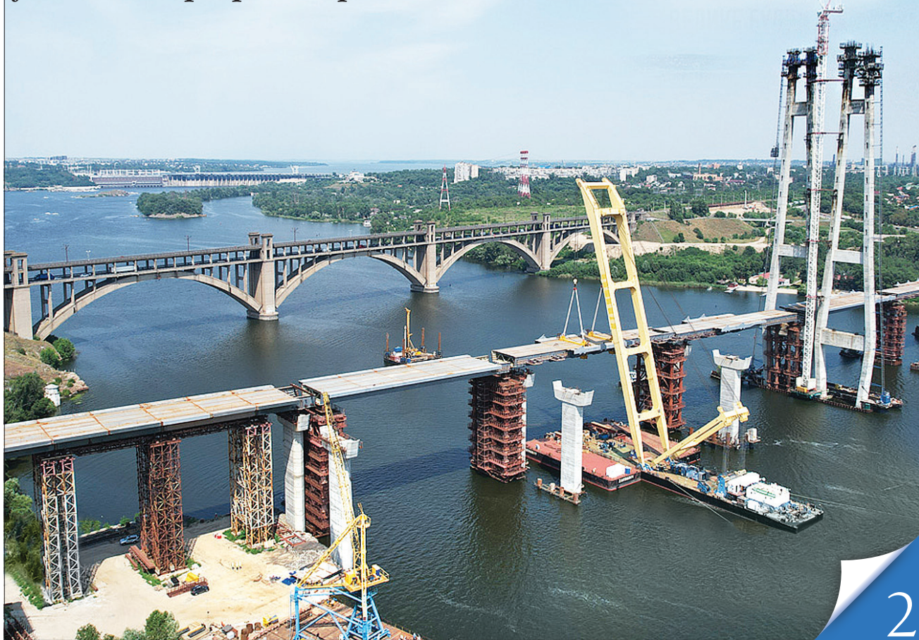
Запорізький міст, найбільший та найвідоміший довгобуд країни, спорудження якого було відновлено завдяки «Великому будівництву»

ІНФРАСТРУКТУРА. Уряд створив можливості для добудови флагманів програми Президента