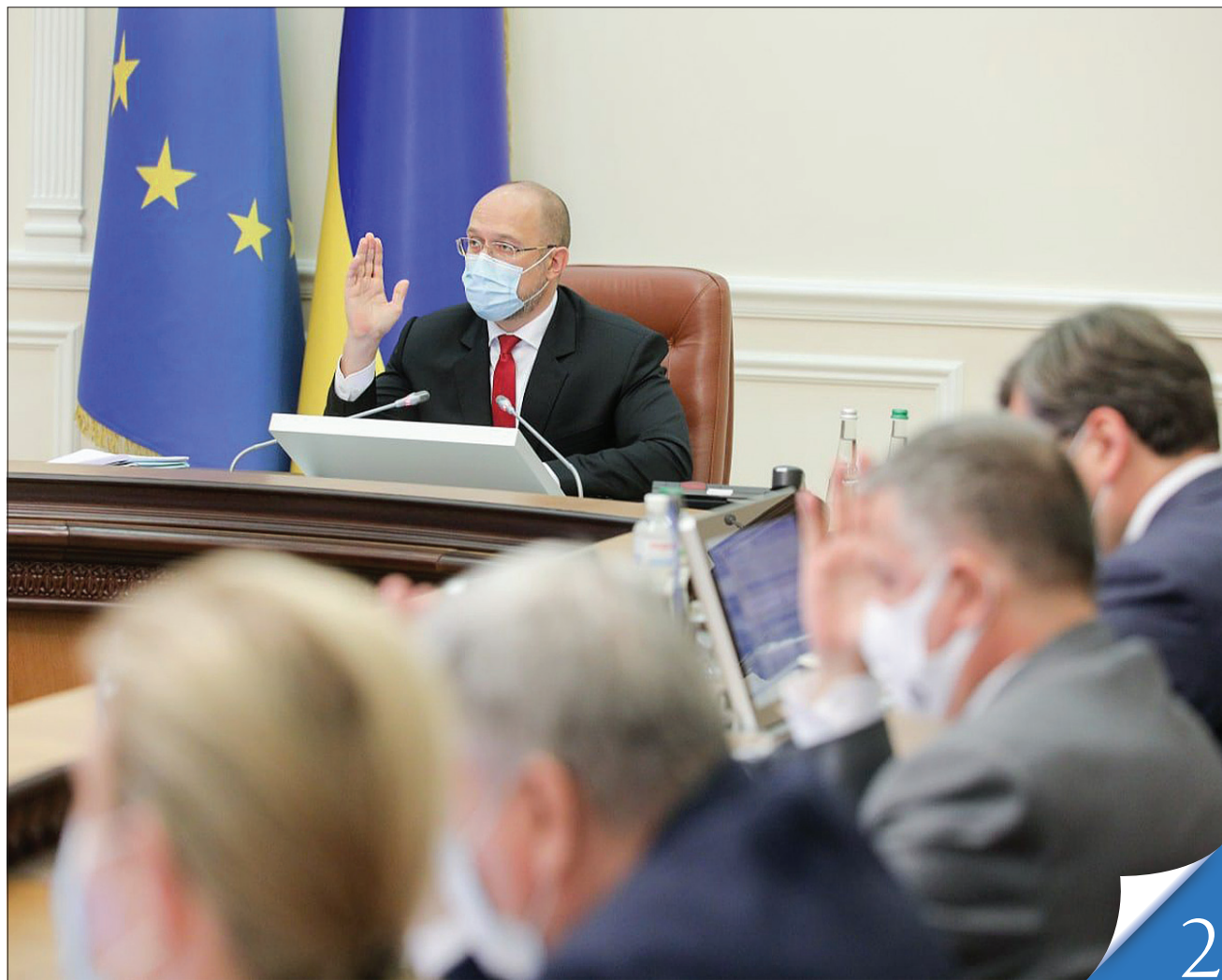
Сотні тисяч військових і працівників інших органів правопорядку отримають додаткові пенсійні виплати, запевнив Прем'єр-міністр Денис Шмигаль

ЗАСІДАННЯ КАБІНЕТУ МІНІСТРІВ. Через недосконалість законодавства з 2018 року великій кількості громадян не індексували виплати. Нині ситуацію виправлено