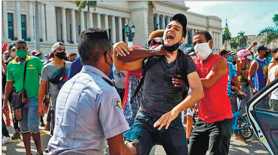
Висловлення протесту на вулицях — рідкісне явище для Куби. Отже, нинішні причини дуже вагомі

Антиурядові демонстрації — велика рідкість для сучасної Куби. Останні акції протесту були тут майже 30 років то-