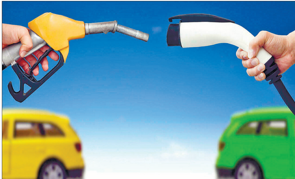
2035 рік, як очікується, стане останнім для традиційних автівок на вуглеводневому паливі

Виведення з обігу всіх автомобілів із двигунами внутрішнього згоряння можна досягнути шляхом поступового скорочення норми викидів CO 2 на кілометр, яка становить 95 грамів на кілометр. До 2035 року її буде зменшено до 0 грамів на кілометр, що стане фактичною заборону продажу автомобілів, які працюють на бензині й дизелі. Для стимулювання продажу й популярності електромобі-