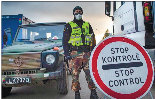
Вільнюс заявив, що побудує стіну на кордоні з Білоруссю для стримування нелегальної міграції

«Ми готові посилити рівень підтримки й надати більше техніки та наших офіцерів. Зробимо це якнайшвидше. Кордон Литви — наш спільний зовніш-