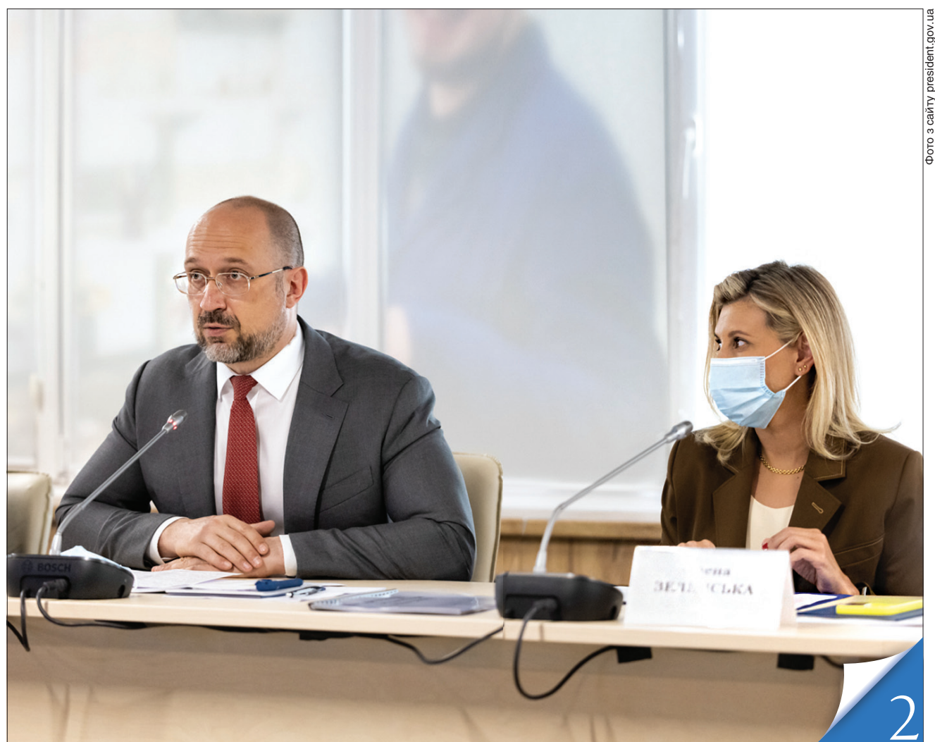
Ініціативу першої леді Олени Зеленської втілюватиме Прем'єр-міністр Денис Шмигаль

БЕЗ ПЕРЕПОН. В уряді сподіваються, що незабаром безбар'єрність і доступність стануть нашими нормами