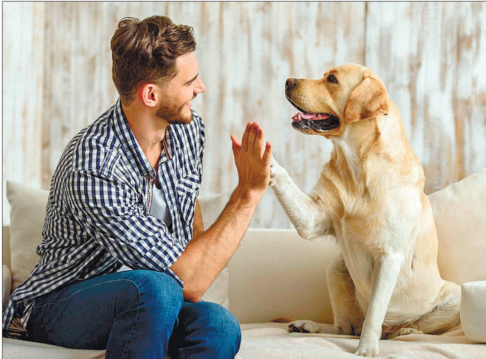
Людам, хворим на COVID-19, варто уникати контакту зі своїми домашніми улюбленицями

Домашні тварини легко переносять коронавірусну інфекцію, більшість взагалі не має жодних симптомів. Учені остерігалися, що вони можуть бути поширювачами інфекції, але первинні результати дослідження свідчать, що це не так. «Тварини, які отримали позитивні результати, швид-