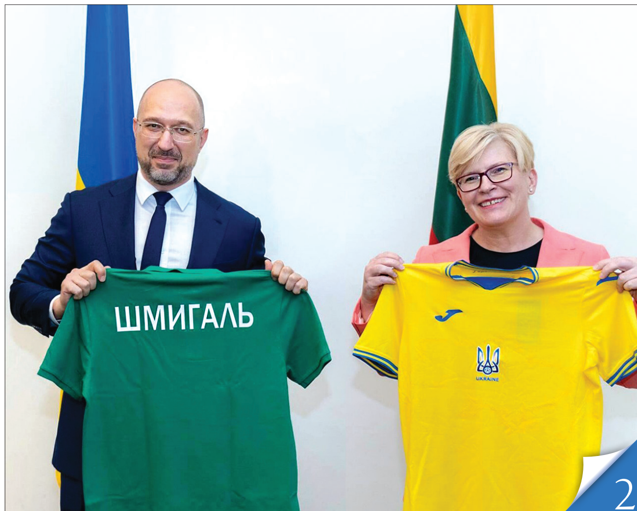
Із литовською колегою Інгрідою Шимоніте Денис Шмигаль одразу знайшов спільну мову

СПІВПРАЦЯ. У Литовській Республіці відбулася четверта Конференція з питань реформ в Україні