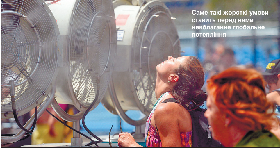
Саме такі жорсткі умови ставить перед нами неблаганне глобальне потепління

У Канаді й на північному заході США кілька міст зафіксували температуру, вищу від попередніх рекордів на п'ять градусів. Так само на п'ять градусів попередній рекорд побила літня температура і в Сибіру. Дослідження британської метеорологічної служби Met Office засвідчило, що така спека в цьому російському регіоні є наслідком