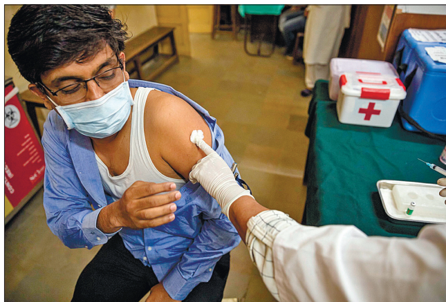
Шахраї проводили вакцинавання, використовуючи підроблену вакцину

Під час слідства було встановлено, що у фінансовому центрі міста Мумбаї провели щонайменше 12 кампаній із вакцинавання, в яких використовували підроблену вакцину. Як заявив представник поліції Мумбаї Вішал Тхакур, замість вакцини шахраї вводили людям солону воду. За його словами, близько 2,5 тисячі людей стали жертвами фейкової вакцинації. Загалом на цій обладці її організатори заробили до 28 тисяч доларів. За словами Вішала Тхакура, поліція заарештувала лікарів, які працювали в лікарні, де виготовляли підроблені сертифікати вакцинації, і які надавали ампули з солоною водою та шприци.