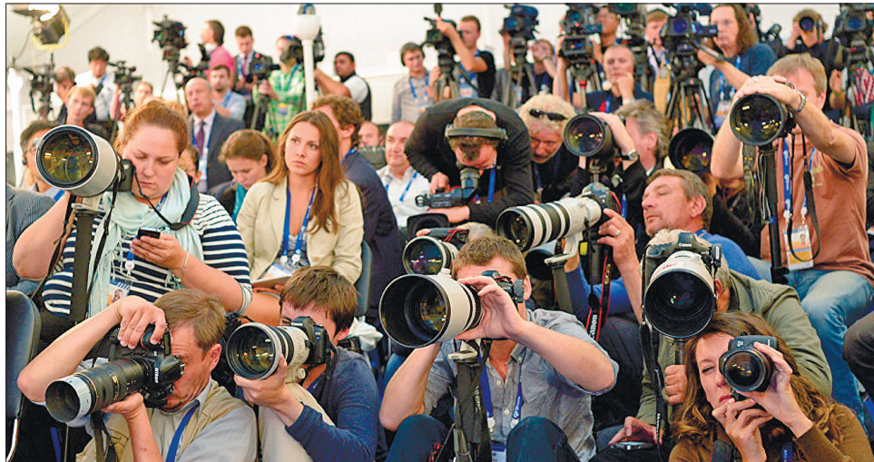
Диктатори й тирани найбільше бояться та ненавидять вільну пресу

Поява в переліку Путіна і Лукашенка — не сенсація. Вони стають фігурантами переліку RSF упродовж останніх 20 років. В організації нагадують, що відтоді, як Володимир Путін обіймає посаду глави РФ, у державі «через професійну ді-