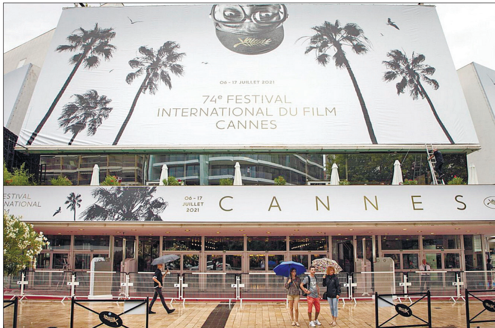
Цьогоріч на кінофестивалі покажуть і дві українські стрічки

Як повідомляв Укрінформ, на Каннському кінофестивалі покажуть дві стрічки від України. У конкурсній програмі «Тиждень критики» за палмову гілку боротиметься ігровий фільм режисера і сценариста Елі Граппа, створений за участі української кінокомпанії Pronto Film — «Ольга». Сюжет фільму розповідає про 15-річну гімнастку, яка живе на дві країни: Швейцарію та Україну. Дівчи-