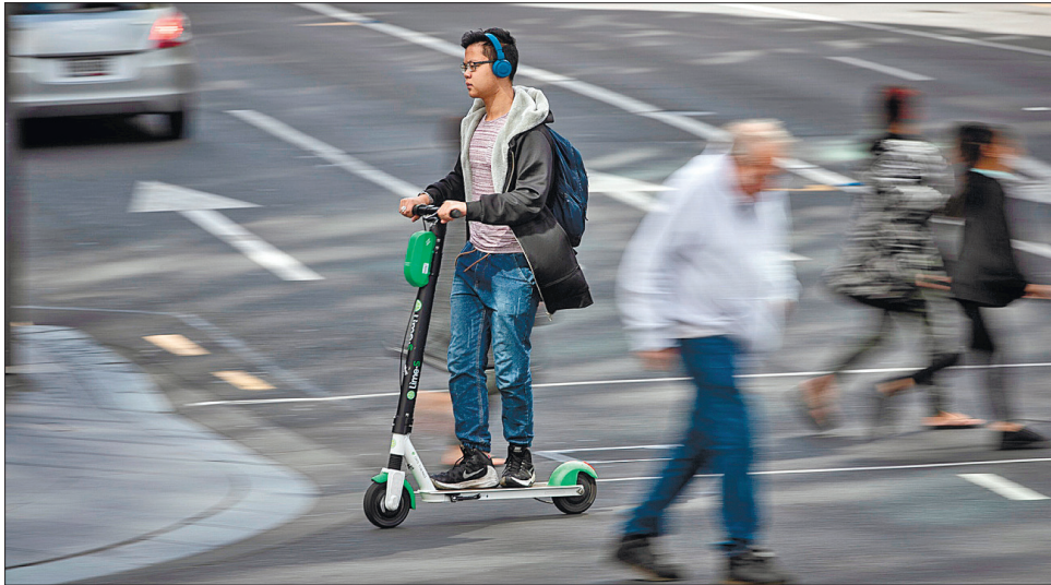
Надмірна швидкість становить небезпеку для оточуючих

«Або ситуація істотно поліпшиться й електроскутери знайдуть своє безпечне місце в громадському просторі, або ми повністю припинимо практику оренди скутерів після того, як терміни контрактів компаній-операторів завершать-