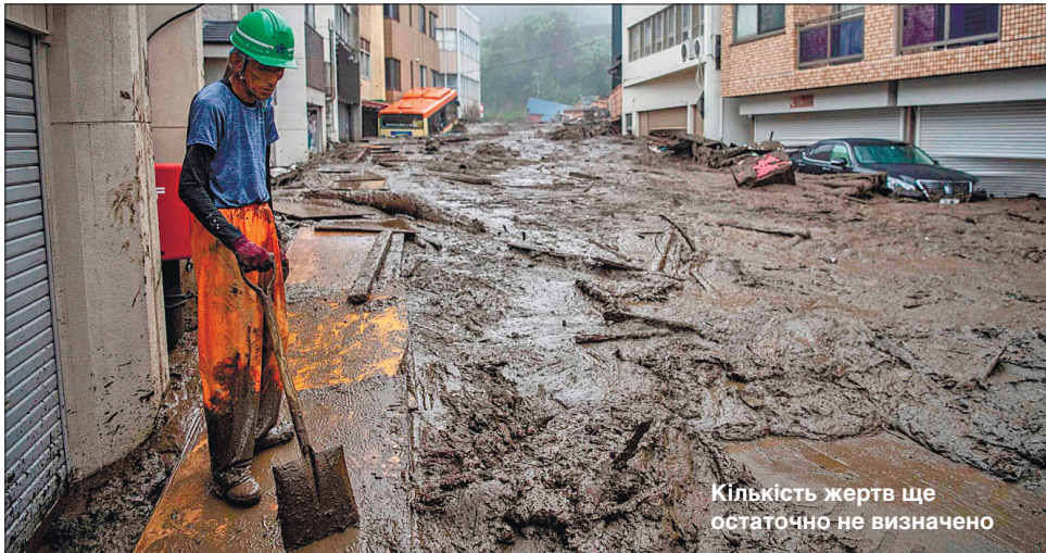
Кількість жертв ще остаточно не визначено

Прем'єр-міністр Японії Йосіхіде Суга ініціював створення спеціальної оперативної групи для усунення наслідків трагедії. До рятувальної операції залучено поліцію, пожежників і військових