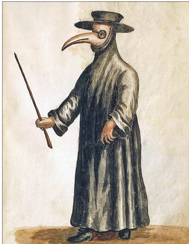
«Чумний лікар» став символом епідемії у середньовічній Європі

За оцінками правоохоронних органів Нідерландів, вилучену партію кокаїну оцінюють у 195 мільйонів євро. На сьогодні вона є найбільшою серед тих, які досі вдалося вилучити у країні.