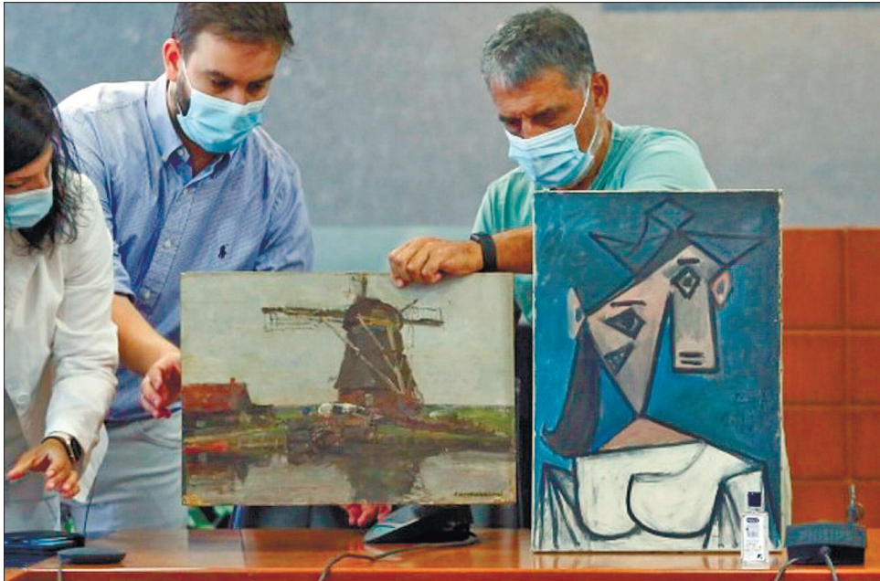
Підозрюваний зберігав картини у своєму будинку і не збирався продавати

Грецька поліція поновила розслідування про викрадення картини у лютому 2020 року, як стало зрозуміло, що робота «Голова жінки» вартістю близько 17 мільйонів євро, не з'являлася на чорному ринку творів мистецтва, а отже, ймовірно, залишається в країні. Міністр культури Греції Ліна Мендоні заявила журналістам, що викрадену картину Пікассо неможливо продати, оскільки на її звороті був напис французькою, зроблений самим художником: «Для грецького народу на знак пошани від Пікассо». «Голова жінки», на