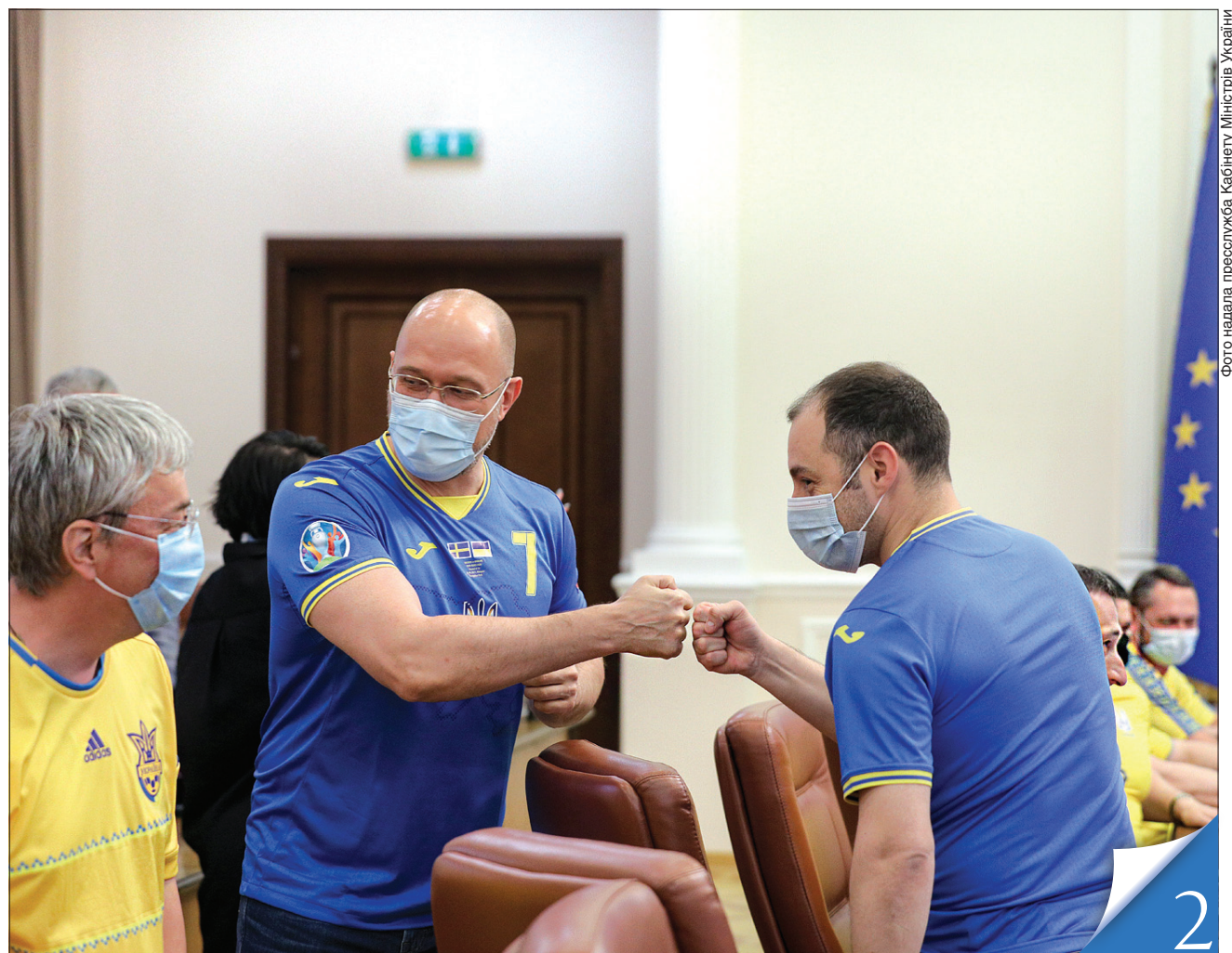
Одягнувши футболки національної збірної, члени Кабінету Міністрів привітали нашу команду з виходом до чвертьфіналу Чемпіонату Європи

ПОСТУП. Запровадження ринку землі та історична гра футбольної збірної надихають і мотивують